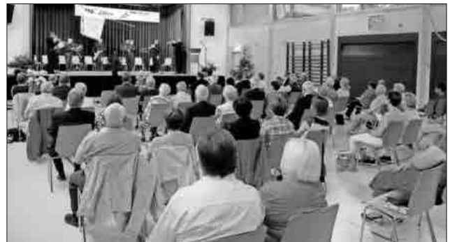
Feierliche Eröffnung durch das Bläserensemble des Musikvereins Heimbach.

Rückblicke und Einblicke in die Aktivitäten der vergangenen Jahre finden sich auch jederzeit unter www.maennerchor-heimbach.de .