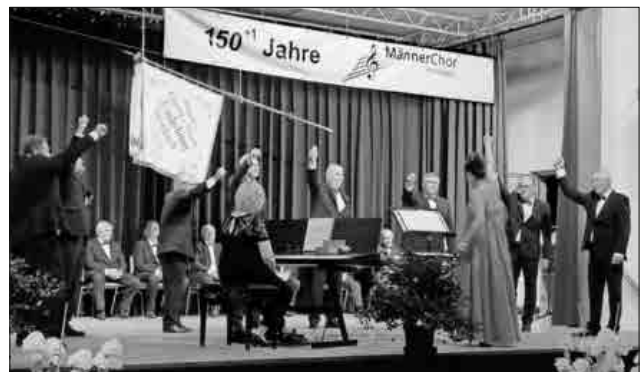
Ensemble Courage vom Männerchor Heimbach mit dem Lied „Life is Life“.