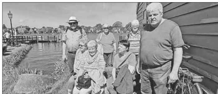
Verschlaufpause in Zaanse Schans.