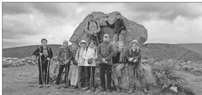
Gipfelbild Hinterwaldkopf mit der ganzen Gruppe.

ders gut. Gestärkt konnte dann auf den letzten Höhenmetern der Aufstieg auf den Hinterwaldkopfgipfel angegangen werden. Die üppig blühenden Bergwiesen begeisterten alle und gemeinsam wurden die Blumen bestimmt. Vom Gipfel aus bot sich ein Rundumblick auf Freiburg und die Rheinebene, den Hochschwarzwald und das Dreisamtal. Der Abstieg führte über urige Pfade zur Höfener Hütte, wo Kaffee und Kuchen oder andere Erfrischungen lockten und auch die Sonne warm vom Himmel schien. Danach ging es über wurzelüberzogene Waldwege und Wiesen an den Abstieg nach Oberried. Am Ende dieser 16 Kilometer langen Tour mit über 800 Höhenmetern waren alle erfüllt von der schönen Wanderung. In der Sportgaststätte Oberried fand der Abschluss statt, bevor man zurück nach Teningen fuhr.