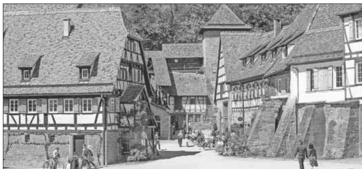
Das Kloster Maulbronn ist heute UNESCO-Weltkulturerbe.

Der Reisepreis beträgt 50 Euro pro Person (Mitglieder 45 Euro). Anmeldung bitte per E-Mail g.u.bv.heimbach@gmail.com oder Telefon 07641 / 47102.