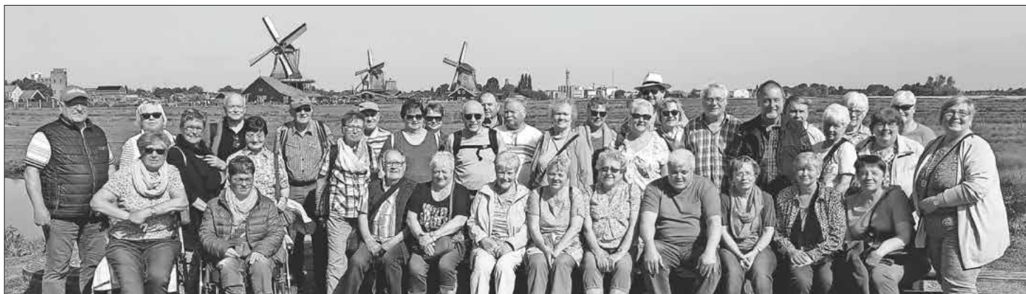
Gruppenfoto der Teilnehmer.