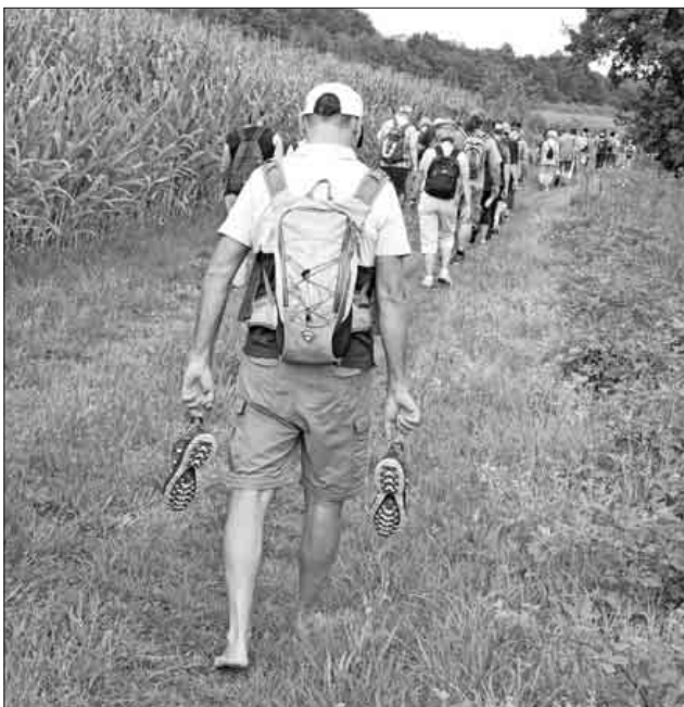
Barfuß durch die Teninger Allmend – ein Erlebnis für Körper, Geist und Seele.

Beginn ist um 10 Uhr beim Parkplatz am Teninger Trimmich-Pfad. Nach der Tour gibt es ein gemeinsames Mittagessen und es erwartet alle Teilnehmer eine Überraschung. Kontakt: 07641/47559.