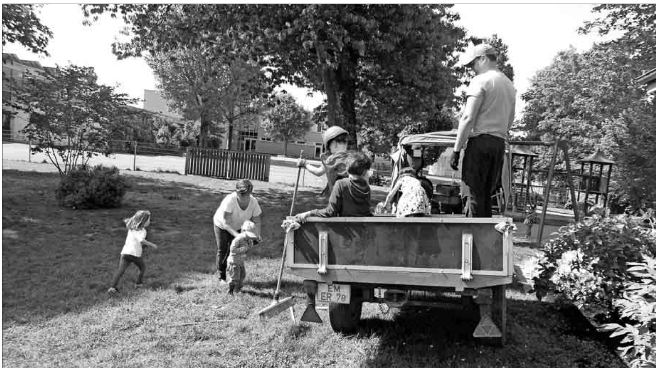
Mit Feuereifer dabei.