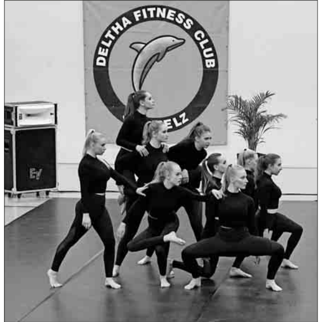
Ausdrucksstark sind die Tänzerinnen von „Jazz à Nova“.

Am 9.6. findet bekanntlich das Saisonfinale „zu Hause“ in der Ludwig-Jahnhalle statt. Bei dem denkbar knappen Abstand von nur einer Platzziffer zwischen dem 3. und 5. Platz und bei dem nicht minder geringen Abstand von 1,5 Platzziffern zwischen Platz 7 und 8 ist ein sehr spannendes Saisonfinale sicher.