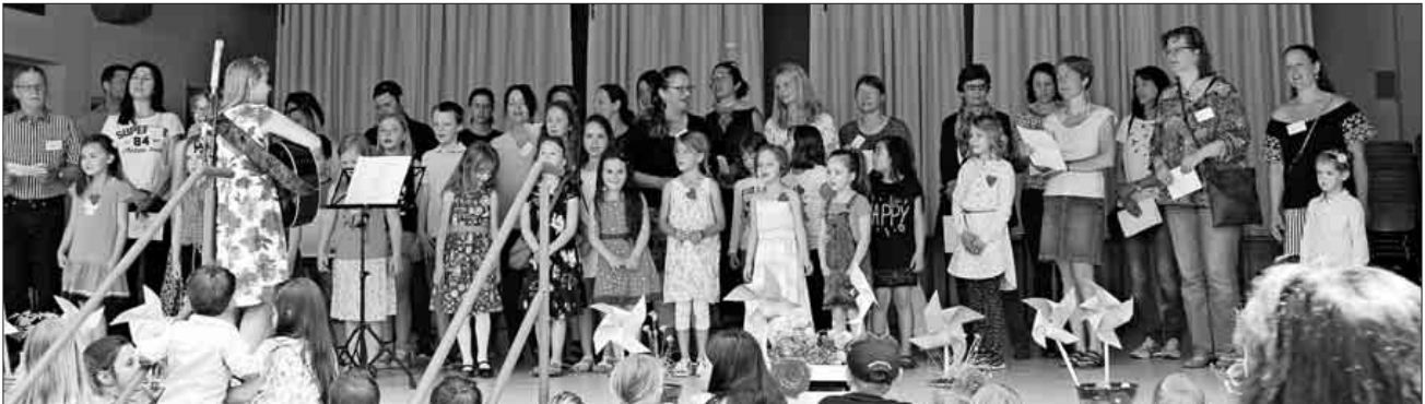
„Vu jedem ebbis“