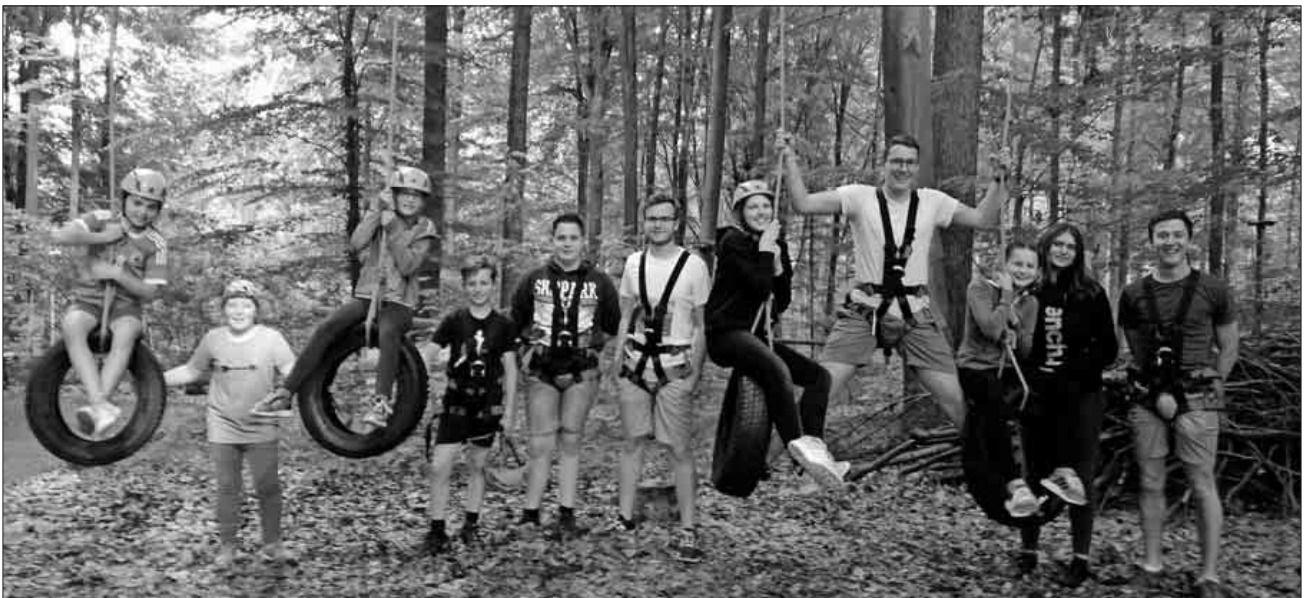
Jungmusiker aus Teningen beim Teamtraining.

Informationen zur Jugendausbildung findet man unter: www.mfk-teningen.de .