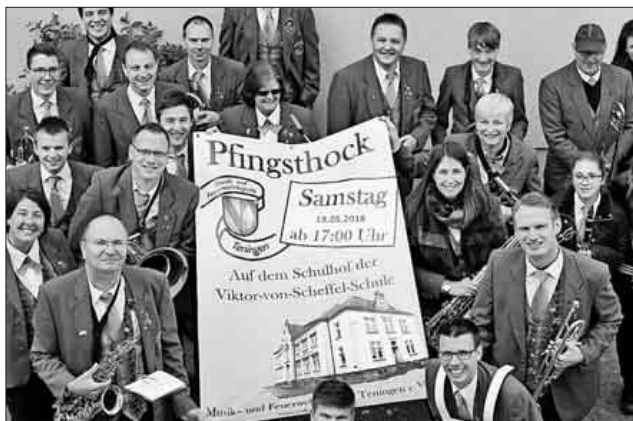
Die Musikerinnen und Musiker der Musik- und Feuerwehrkapelle Teningen freuen sich auf alle Besucher beim diesjährigen Pfingsthock.

Die Musik- und Feuerwehrkapelle Teningen freut sich, alle Interessierten recht herzlich zu einem gemütlichen Abend begrüßen zu dürfen.