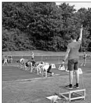
Sprintstart beim Abendsportfest im Emil-Schindler-Stadion

Beim 15. Abendsportfest der TuS Leichtathleten gab es fast perfekte Bedingungen für die 130 Teilnehmer/Innen. Ein paar Regentropfen konnten die teilweise guten Leistungen vor allem im Sprint, im Speerwurf und im Weitsprung nicht groß beeinflussen.