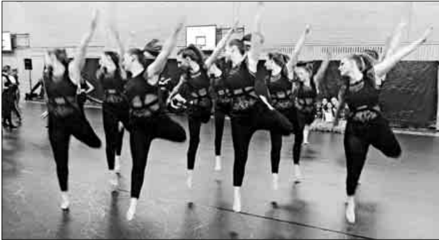
„Effect“ sehr effektiv bei der Endrunde in Mannheim.

Die Wertungen im Finale ergaben dann den 7. Platz, wobei erfreulicherweise eine Wertung „Effect“ auf dem 5. Platz gesehen hatte. Dies bedeutet Chancen für eine Steigerung beim Finale daheim am 9. Juni in der Ludwig-Jahn-Halle in Teningen.