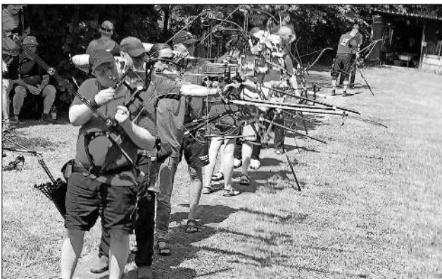
Volle Konzentration, bevor der Pfeil zu seinem Flug entlassen wird.