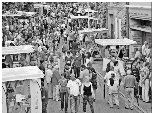
Die letzten Kaiserstuhl-Tuniberg-Tage fanden 2014 in Ihringen statt (Foto). Für die Veranstaltung in Nimburg erwarten die Verantwortlichen einen ebenso großen Besucherandrang.

In der Poststraße warten das Spielmobil der Gemeinde Teningen und diverse Geschicklichkeitsspiele der Kindergärten Sonnenschein und Regenbogen auf die kleineren Besucher. Die