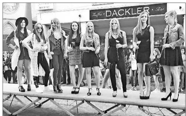
Stolz wurde die Sommerkollektion präsentiert.

Vielen Dank an alle, die bei der Organisation und Durchführung mitgewirkt haben, an die Teilnehmerinnen des Projektes 2000, an Elke Schweizer sowie an die Fotografin Hannah Rombach.