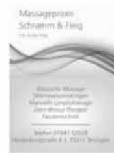
Massagepraxis Schramm & Fleig