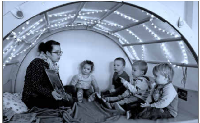
Gespannt lauschten die Kinder beim Vorlesetag.

Die Erzieherinnen der Kleinkindgruppe organisierten einen Tag rund um das Buch. Jedes Kind der Kleinkindgruppe durfte an diesem Tag ein Buch von zu Hause mitbringen, welches dann in kleinen Gruppen und in einer gemütlichen Leseecke vorgelesen wurde. Die Kinder waren mit voller Begeisterung dabei und lauschten den vielfältigen und spannenden Geschichten. In den Räumen herrschte eine magische Stimmung. Den Erzieherinnen ein ganz herzliches Dankeschön für ihr Engagement.