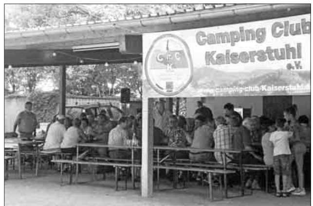
Der Campingclub Kaiserstuhl lud zum gemütlichen Beisammensein ein.

Bis nach Mitternacht haben einige den gelungenen Abend genossen. Der Dank geht an die vielen fleißigen Hände, die das Fest organisiert haben, Kuchen und Salate spendeten und an den Club, der Grillgut und Getränke spendierte.