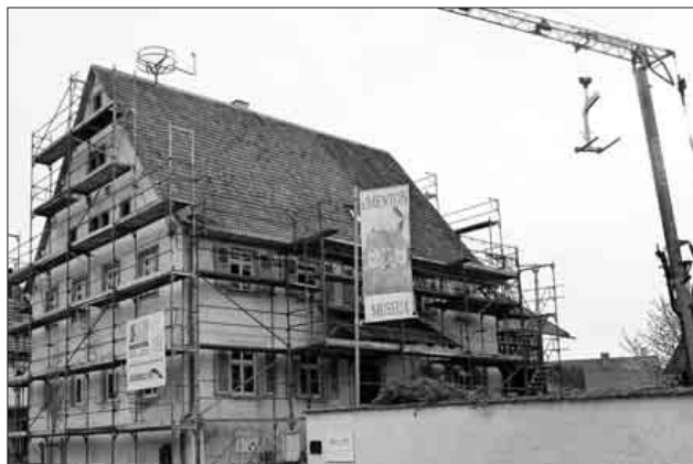
Das Dach des Menton Museums ist saniert. Bis Ende Juni soll ein neuer Anstrich das Haus zieren.