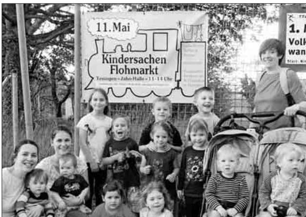
Unter der Mithilfe der Kinder wurden die Werbebanner an den Ortseingängen für den Spiel- und Kindersachenflohmarkt aufgehängt.

Restlos ausgebuht sind alle Tische für den großen Spielzeug- und Kindersachen-Flohmarkt am Samstag, 11. Mai, in der Ludwig-Jahn-Halle in Teningen. Mit über 150 Ständen ist der Flohmarkt aktuell der größte in ganz Südbaden. Für Kinder und Jugendliche, die ihre Spielsachen auf einer Decke verkaufen wollen, gibt es noch Platz im Foyer oder bei gutem Wetter vor der Halle. Am Wochenende wurden unter tatkräftiger Mithilfe der Kinder die Werbebanner an den Ortseingängen aufgehängt. Eingeladen sind alle, die gerne stöbern oder sich mit Spielsachen und Kinderkleidern eindecken wollen. Das Orga-Team sorgt für Speisen und Getränke, eine große Kuchen-Theke mit über 70 leckeren Kuchen rundet das gastronomische Angebot ab. Auch für ein buntes Rahmenprogramm mit Maltisch, Kinderschminken und vielem mehr ist gesorgt. Der gesamte Erlös kommt den Projekten des St.-Franziskus-Kindergartens zugute.