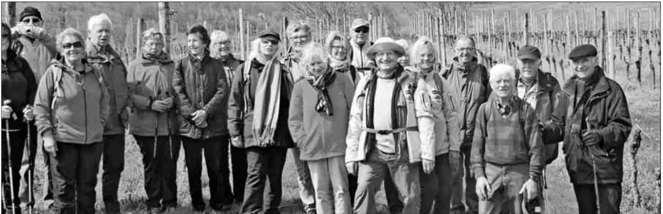
Die Wandergruppe auf dem Steinkauzpfad.

deutlich erkennbaren Dreisamtal und der Stadt Freiburg. Ein Stück weit ging es noch über den bewaldeten Rücken des Gagenhart, um dann nach rechts, von großen Flächen Maiglöckchen gesäumt, Richtung Bötzingen abzubiegen. Durch von Rebumlegungen geprägter Landschaft stößt man kurz vor dem Bötzingener Ortsteil Oberschaffhausen, auf den Bötzingener Brunnenpfad. Es wurde Zeit für eine Vesperpause, die auf dem dortigen Spielplatz stattfand. Ein besonderes Erlebnis war, dass eine Anliegerin die Wanderteilnehmer mit zwei Flaschen Wein spontan bewirtete. Ein kurzes Stück an der Durchgangsstraße entlang und an der St. Albankapelle vorbei ging es alsbald über den Dettenberg in ein typisches Lösstal des Ostkaiserstuhls. Spätestens ab hier kann man sich vergegenwärtigen, warum die Strecke nach dem Steinkauz benannt worden ist: Mächtige Kirschbäume, im Talboden auch Kernobst, zieren die Terrassen. Auf dem Lerchenberg angekommen, sieht man Eichstetten malerisch unten liegen. Hier am Degental wurde der Steinkauzpfad verlassen und den Ort bis zum Friedhof umgangen. Von dort führte der Weg an der Kirche vorbei, über die historische Dreisambrücke und an der alten Dreisam entlang zum Bahnhof Nimburg zurück, wo die müden Wanderer nach 12,5 km und 4,5 Stunden Wanderzeit, sich bei einem zünftigen Vesper im gastfreundlichen „Bahnhöfle“ wieder erholten.