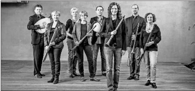
Ensemble „Capella de la Torre“.