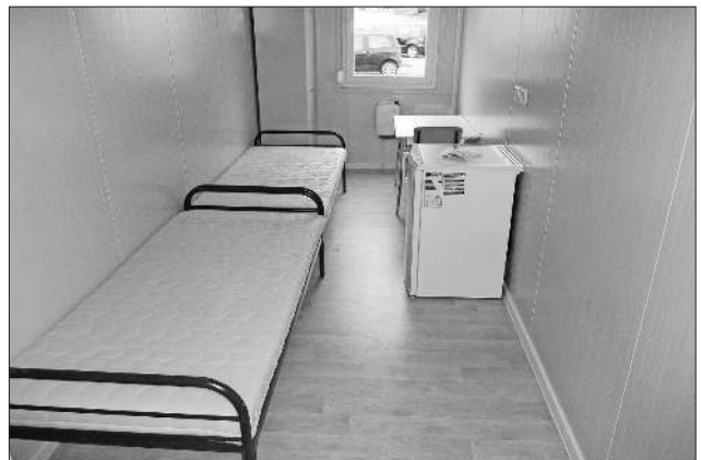
Ein Zimmer der Unterkunft.