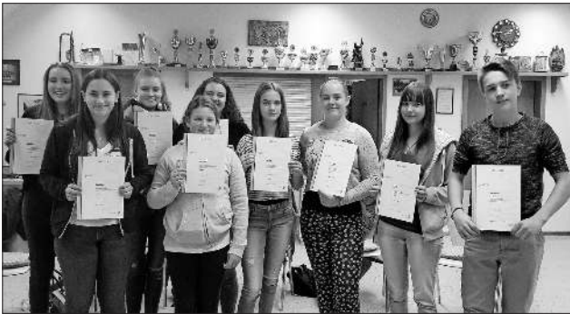
Die glücklichen Teilnehmer nach der erfolgreichen Prüfung.