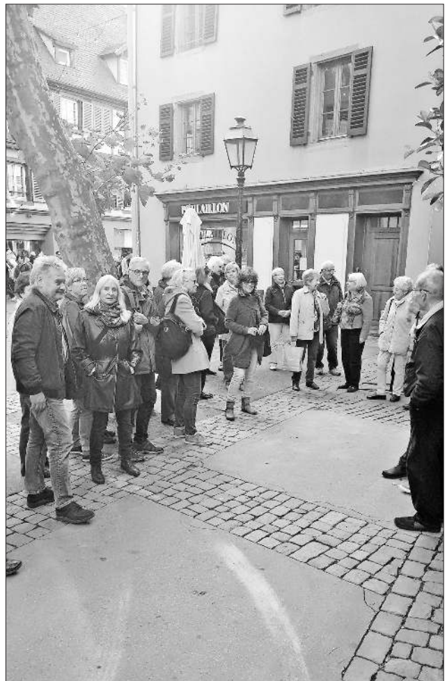
Die Teilnehmer vor der Dominikaner-Kirche.