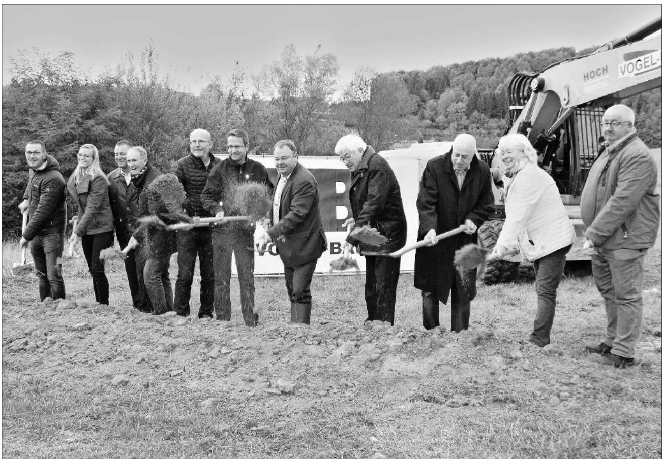
Mit dem symbolischen Spatenstich können die Erschließungsarbeiten beginnen.