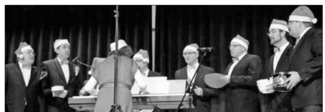
Ein gemeinsames Lied mit den „Vokalisatoren“.