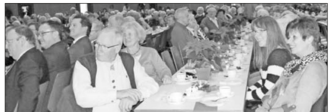
Man amüsiert sich.