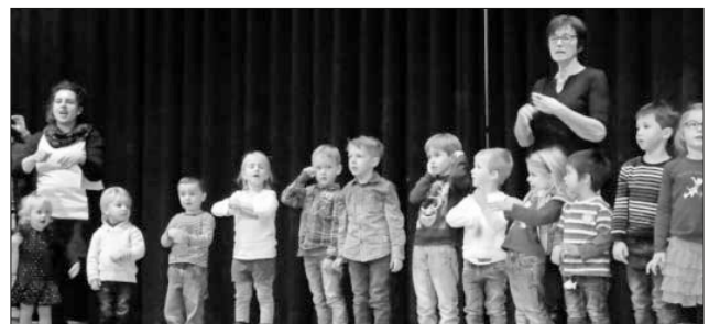
Auch die jüngsten Gemeindemitglieder sind mit Eifer dabei.