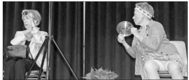
Zwei Frauen im Zug.