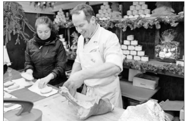
... wartet auch dieses Jahr auf die Besucher