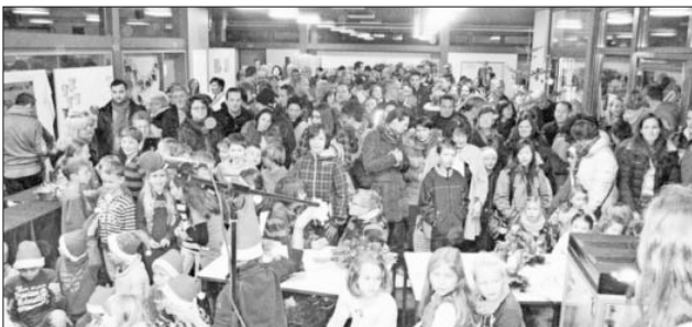
Vorweihnachtliche Stimmung auf dem Bazar.

Zum Verkauf standen: die beliebten Adventskränze, selbst gemachtes Weihnachtsgebäck, gebrannte Mandeln, Weihnachtsbasteleien sowie Punsch, Weihnachtströdel und gebrauchte Bücher. Vorführungen aller Klassen der Grundschule rundeten das Angebot ab, sodass die Adventszeit in familiärer Atmosphäre eingeläutet werden konnte.