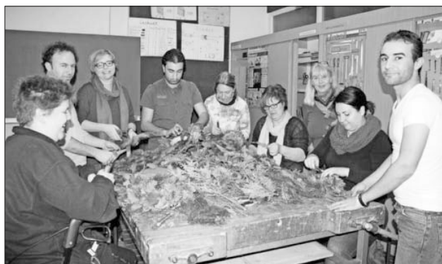
Mit Eifer bei der Arbeit.