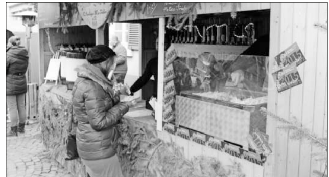
Ein reichhaltiges, kulinarisches Angebot ...

City-Bus und Anruf-Sammel-Taxi im Einsatz: Auch in diesem Jahr bietet die Gemeindeverwaltung an diesem Adventswochenende Sonderfahrten an für diejenigen, die die Umwelt schonen wollen. So wird innerhalb der Gemeinde der City-Bus und für die Ortsteile Landeck und Bottingen das Anruf-Sammel-Taxi eingesetzt. Der Preis beträgt 1,50 Euro je Fahrt; Kinder bis zwölf Jahre dürfen kostenlos mitfahren (Fahrplan auf Seite 4).