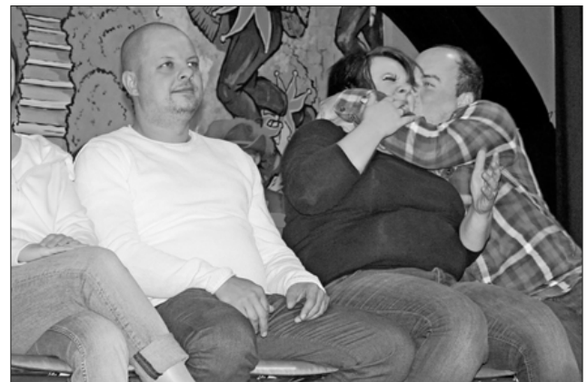
Verwicklungen in einer Kinositzreihe.