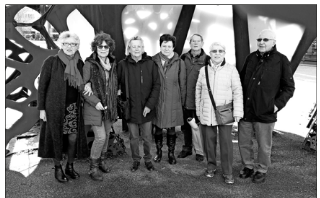
Ein kleiner Teil der am Bauhaus interessierten Gruppe.

Ein Tipp: Interessierte können mal auf die aktualisierte Homepage des Kulturvereins schauen unter „kulturverein-teningen.de“. Hier finden sich unter anderem Hinweise und Informationen zu den weiteren Veranstaltungen des Kulturvereins im Laufe des Jahres.