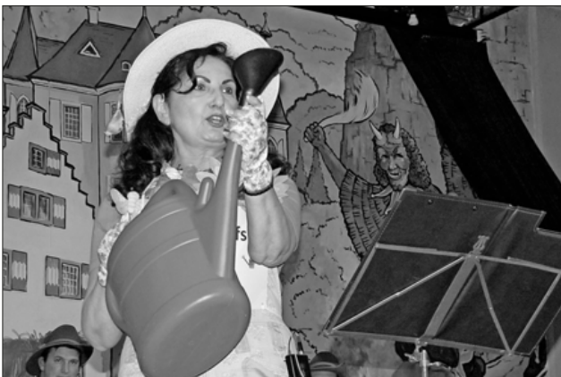
Eine Mainzer Hobbygärtnerin.

Nach über fünf Stunden endete ein stimmungsvolles Erdbeben, das mit lauten Jubelrufen ein schönes Ende fand. Dank auch an den Sportverein, der für eine flinke Bewirtung sorgte, und an die Technik, die wieder mal alles im Griff hatte.