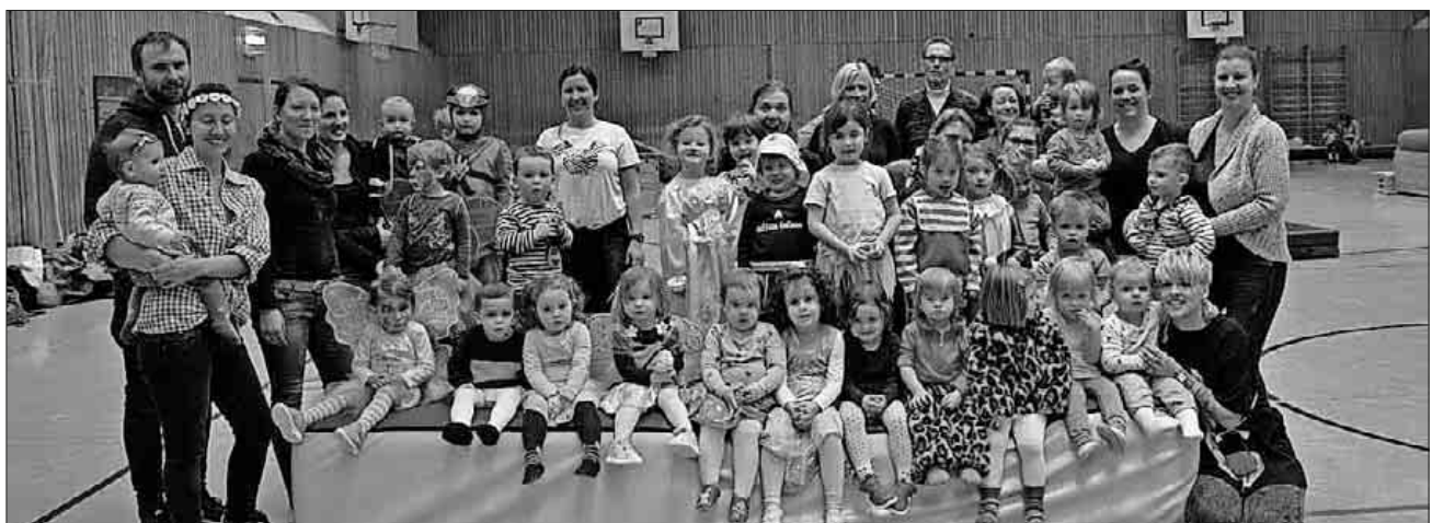
Zum regulären Kinderturnen durften die Kinder dieses Mal in Verkleidungen kommen und hatten beim Kinderschminken und Turnen viel Spaß.