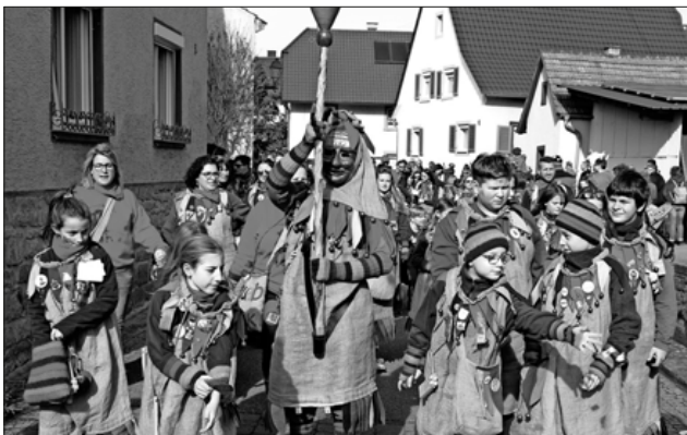
Voran die Kindringer Ruäbsäck.