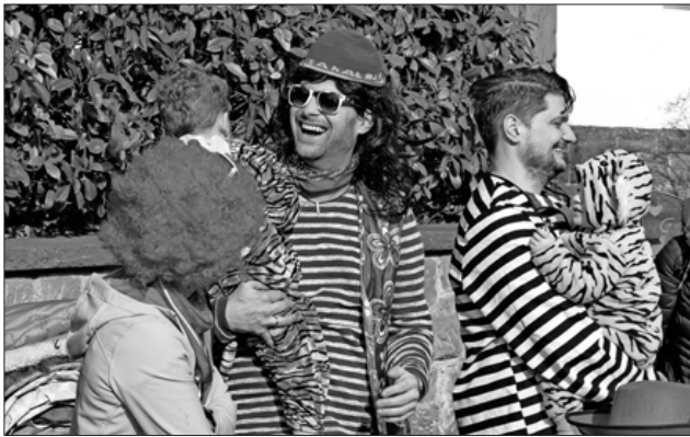
Die Zuschauer entlang der Umzugsstrecke hatten ihren Spaß.