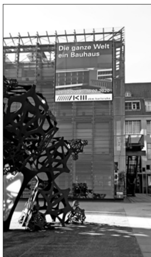
Eingang zur Ausstellung „Die ganze Welt ein Bauhaus“.

Mit dem Kulturverein Teningen im Zentrum für Kunst und Medien (ZKM) in Karlsruhe: Nach Stationen in Argentinien, Mexiko und den USA feiert die Ausstellung „Die ganze Welt ein Bauhaus“ im Zentrum für Kunst und Medien (ZKM) in Karlsruhe ihre Premiere in Deutschland. Aus Anlass des 100-jährigen Bauhaus-Jubiläums zeigt die Tournee-Ausstellung, wie das Bauhaus zum Inbegriff einer gestalterischen und sozialen Radikalerneuerung wurde. Das Staatliche Bauhaus wurde 1919 in Weimar gegründet und avancierte innerhalb von nur 14 Jahren zum Symbol moderner Gestaltung und avantgardistischer Lebensführung. Eine engagierte Kurato-