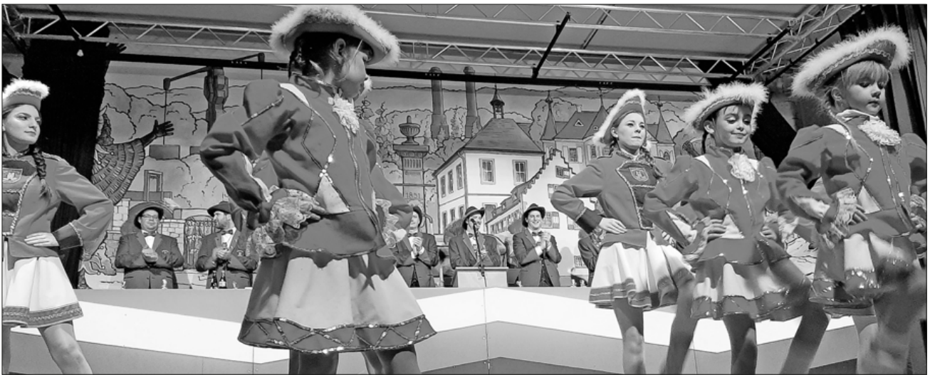
Die Mädchengarde startete die erste Stimmungsrakete.

sich in einer vollbesetzten Kinositzreihe aufteilen mussten, sprengte das Übliche an Mimik und persiflierender Komik.