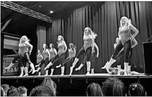
En Vogue bei ihrem Auftritt bei der Dorffasnet in Köndringen.

Wem eine Zeitreise nicht genügt und nochmals eine „Zugabe“ von „En Vogue“ mit ihrem Showtanz sehen möchte, kann gerne am 28. März den Weg nach St. Georgen im Schwarzwald auf sich nehmen. Dort wird die Gruppe am lokalen Showtanzwettbewerb teilnehmen.