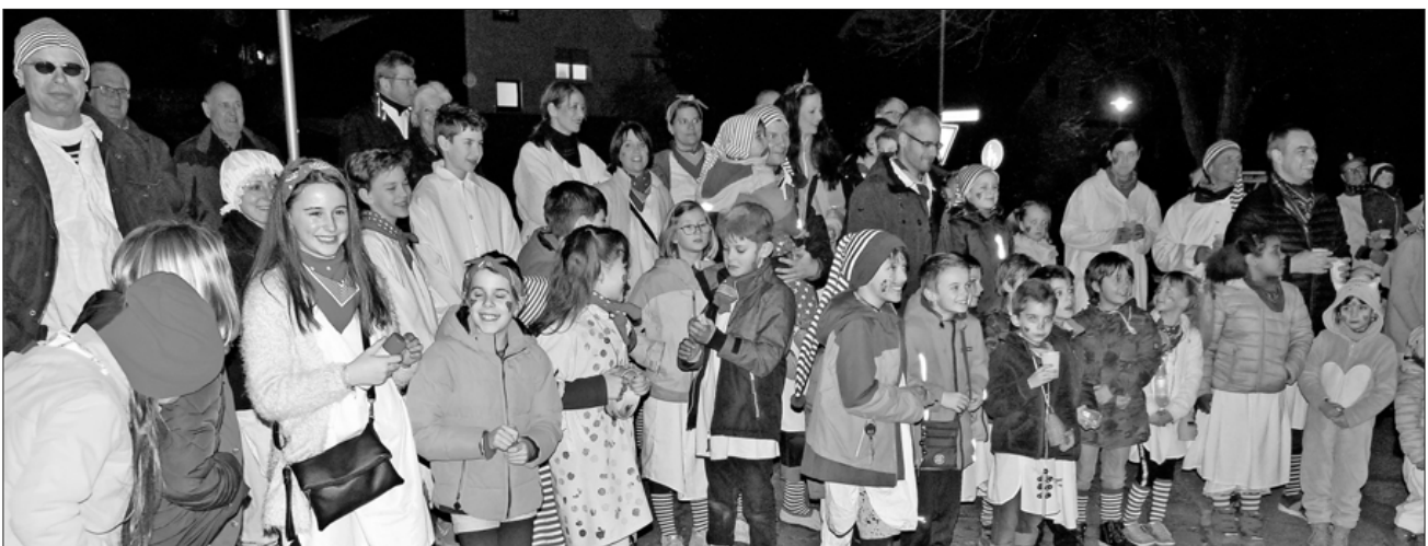
Gespannt warten die Kinder auf den Rathaussturm.