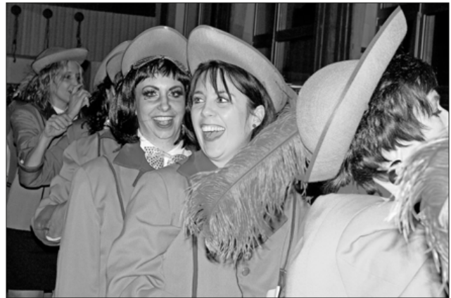
Frauen an die Macht.