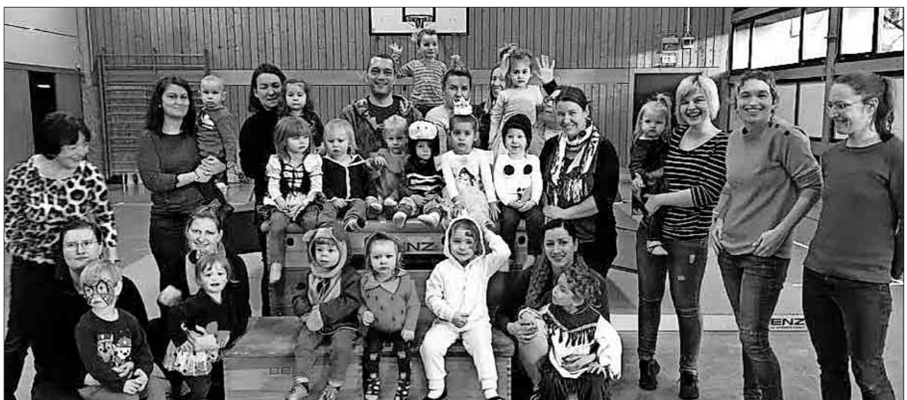
Einige Kinder des Eltern-Kind-Turnens.