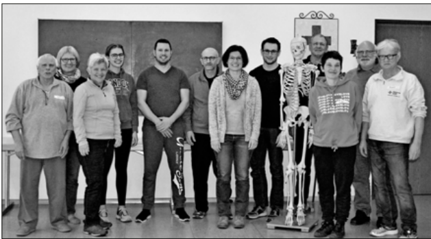
Die Trainer des TuS Teningen beim Erste-Hilfe-Kurs.