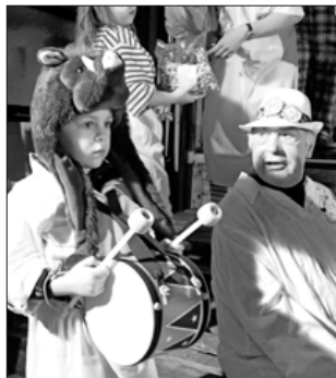
„Heute hauen wir auf die Pauke!“