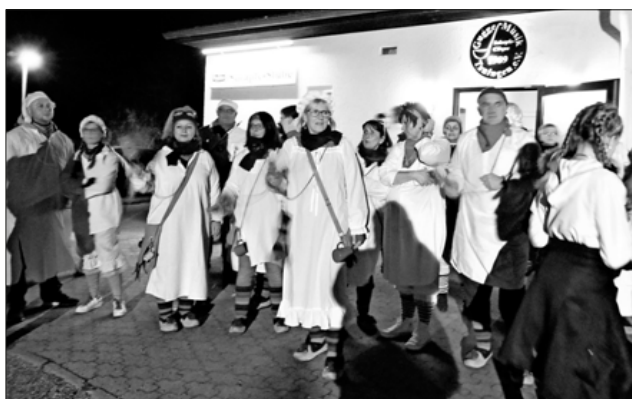
Die Socken verraten es, es sind die Kindringer Ruäbsäck.