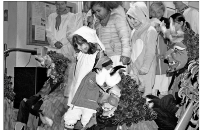
Erfolgreich können die Kinder das Rathaus verlassen.

Ohne einen reichlichen Gutzele-Regen wollten die Kinder jedoch nicht am Weißhemden-Umzug teilnehmen. Voran der Musikverein Heimbach, zog der Hemdglunkerumzug in die Anton-Götz-Halle, um reichlich Spaß zu haben und den närrischen Endspurt miteinander zu beginnen.