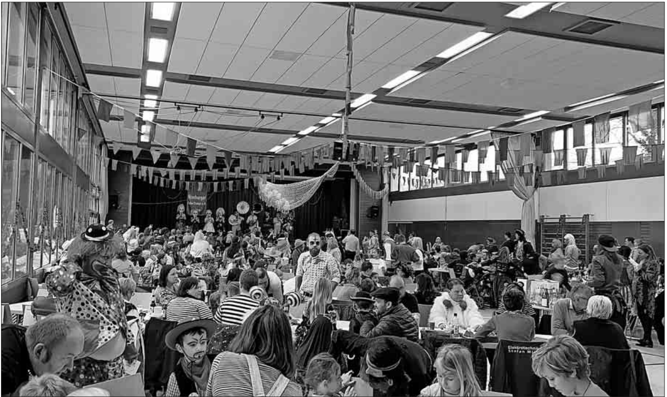
Die Kinderfasnet der Nimburger Felse-Trieber war gut besucht.