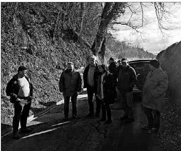
Ein großes Thema bei der diesjährigen Flurbegehung in Nimburg waren die Straßenausbesserungsmaßnahmen in den Feldwegen.

Trotz eingeführtem zweijährigem Rhythmus halten sich die zu bearbeitenden Punkte aus der Flurbegehung in Nimburg in Grenzen. Im Wesentlichen ging es um Straßenausbesserungsmaßnahmen in den Feldwegen, unabhängig von der Art der Befestigung. Weitere Punkte betrafen das Lichtraumprofil, welches nicht immer eingehalten wird. Aus diesem Grund wird das Ordnungsamt der Gemeinde Teningen die Eigentümer anschreiben und um Rückschnitt bitten. Dass die Größe der landwirtschaftlichen Fahrzeuge zum Teil nicht mehr zu den alten Feldwegebreiten passt, zeigte sich an verschiedenen Hohlwegen, wo die Wegeborde abgefahren wurden. Die eingeschränkte Wasserführung von Gräben und Bächen war auch Bestandteil der diesjährigen Begehung.