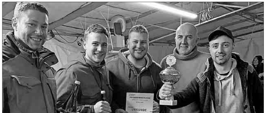
Das Siegerteam „Kindringer Bärsh“ mit den Wertungsrichtern.

Die Feuerwehr Teningen, Abteilung Köndringen, möchte sich bei allen wetterfesten Gästen bedanken, die sich trotz Wind das Scheibenschlagen am vergangenen Samstag und Sonntag nicht entgehen lassen wollten. Ein weiterer Dank gilt allen Teams, die beim Preisscheibenschlagen mitgemacht haben, besonders dem Siegerteam „Kindringer Bärsh“ und dem „Team-4“ und den „Führungskräften“ für den zweiten und dritten Platz. Ein Dank geht auch an alle Helfer, die das Scheibenschlagen auf- und abgebaut und am Samstag und Sonntag bewirten haben.