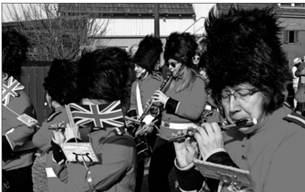
Die Briten kommen, der Musik- und Spielmannszug der Freiwilligen Feuerwehr Abteilung Köndringen.