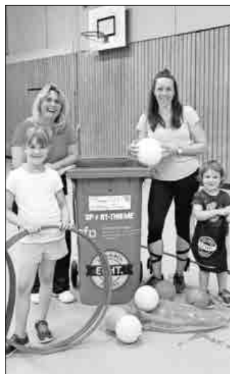
Die Kinder freuten sich über die vom ZfP Emmendingen gesponserten neuen Spielsachen.

Pünktlich zum Kindergartenstart nach den Sommerferien erhielten die kleinsten Turnerinnen und Turner des TuS Teningen sowie ihre Eltern eine neue Balltöne sowie verschiedene Bälle und Reifen. Gesponsert wurde dies vom ZfP Emmendingen, das seit rund einem Jahr Vereine von Mitarbeiterinnen und Mitarbeitern unterstützt. Dank dieser tollen Aktion und der neuen Utensilien wird nun mehr Ordnung im Hallenalltag unter den verschiedensten Sportarten geschaffen und auch den Kindern viele neue Spielmöglichkeiten (an)geboten werden. Die Kinder haben sich riesig gefreut und alle Spielsachen gleich auf Herz und Nieren geprüft.