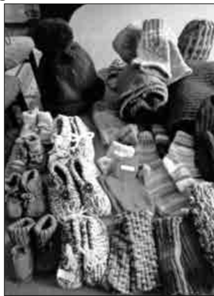
Wie jedes Jahr wird es auch diesmal eine große Auswahl an Handgestricktem geben.

Die Handarbeitsgruppe des DRK-Ortsvereins Teningen verkauft am 1. November von 11 bis 16 Uhr in der Ludwig-Jahn-Halle ihr umfangreiches Angebot an Handarbeitswaren. Verkaufstische in großzügigem Abstand, die 3-G-Regelung sowie ein Hygienekonzept ermöglichen die Darbietung des riesigen Angebotes. Im Foyer der Halle findet Kuchenverkauf „to go“ statt.