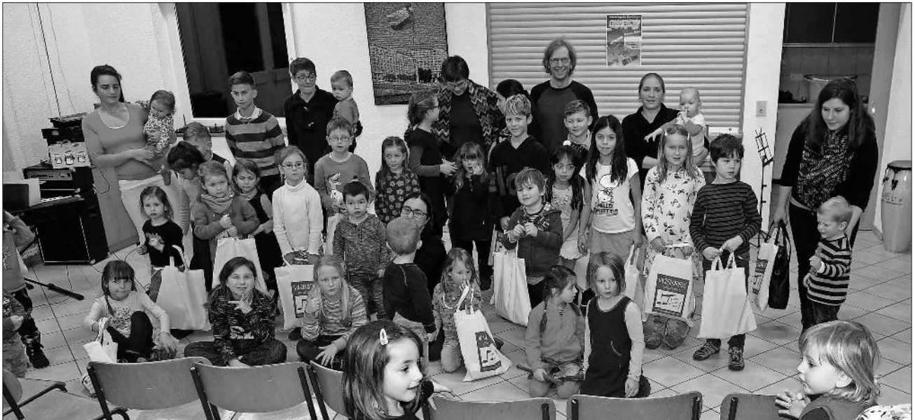
Die Akteure dieses Nachmittags.

Im Januar beginnen neue Kurse, nähe Informationen unter www.winzerkapelle.de .