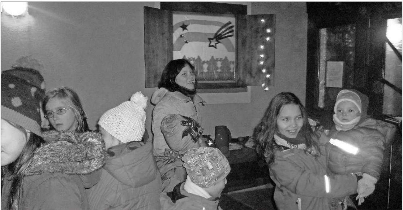
Adventsfenster der Bücherei.

Bei Glühwein und Kinderpunsch kam anschließend ein fröhliches Beisammensein im Nimburger Breitackerweg vor dem Gemeindehaus zustande. Jung und Alt, neu Zugezogene und Alteingesessene trafen sich. Auch die Antoniter-Grundschule in Nimburg, die beiden Kindergärten von Nimburg und Bottingen, Nimburger Geschäfte, Vereine und Familien und wie in den vergangenen Jahre auch, der Reiterhof Königer, beteiligten sich an dem schönen Brauch. So kamen auch 2016 wieder viele besinnliche und fröhliche Adventstreffen zustande. Die evangelische Kirchengemeinde Nimburg-Bottingen dankt allen Bereitwilligen, die mitgewirkt haben, von Herzen.