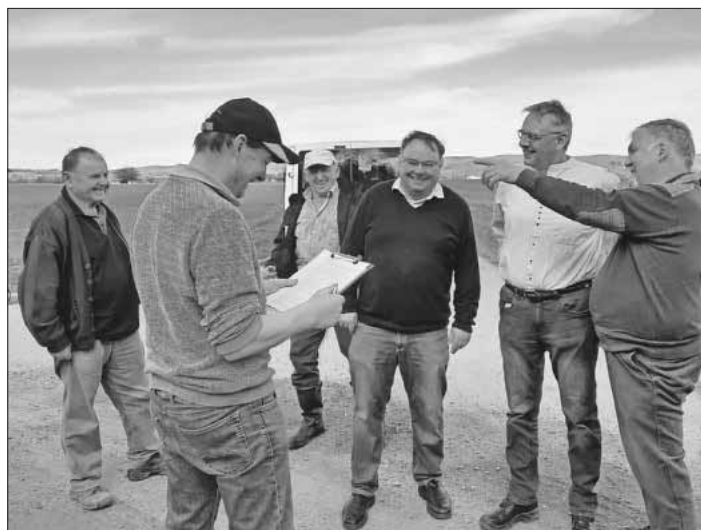
Bei der Flurbegehung in Teningen wurden aktuelle Probleme sowie Lösungsansätze vor Ort debattiert.