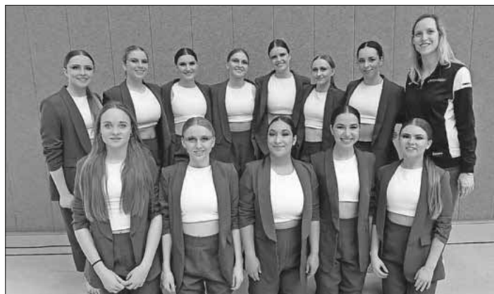
Regionalligaformation Effect für 2023 des TSC Teningen.