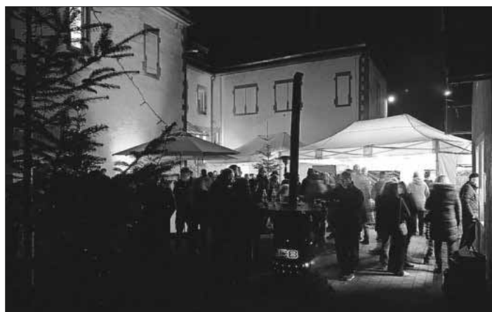
Die erste „WinterNacht“ der Winzerkapelle Köndringen auf dem alten Schulhof vor dem „Haus der Musik“.

In der ersten Woche veranstaltete die Winzerkapelle die erste „WinterNacht“ auf dem alten Schulhof vor dem „Haus der Musik“. Bereits zu Beginn strömten die Besucher auf das festlich geschmückte Gelände. Der sonst so triste Schulhof wurde von den Aktiven kurzerhand mit viel Lichttechnik und etlichen großen Tannenbäumen in eine gemütliche Winterlandschaft verwandelt. Mit Flammenkuchen und etlichen winterlichen Getränken wurden die zahlreichen Besucher verwöhnt. Eine Veranstaltung mit Wiederholungspotenzial. Die Winzerkapelle freut sich, auch im nächsten Jahr die Besucher bei einer „WinterNacht“ begrüßen zu dürfen.