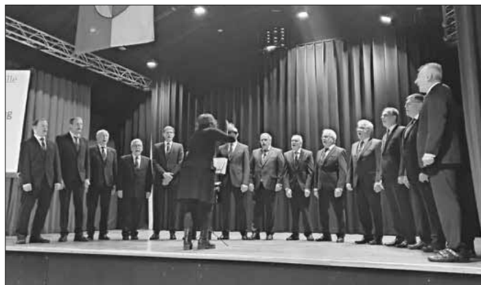
Der Männerchor Heimbach eröffnete den Neujahrsempfang.