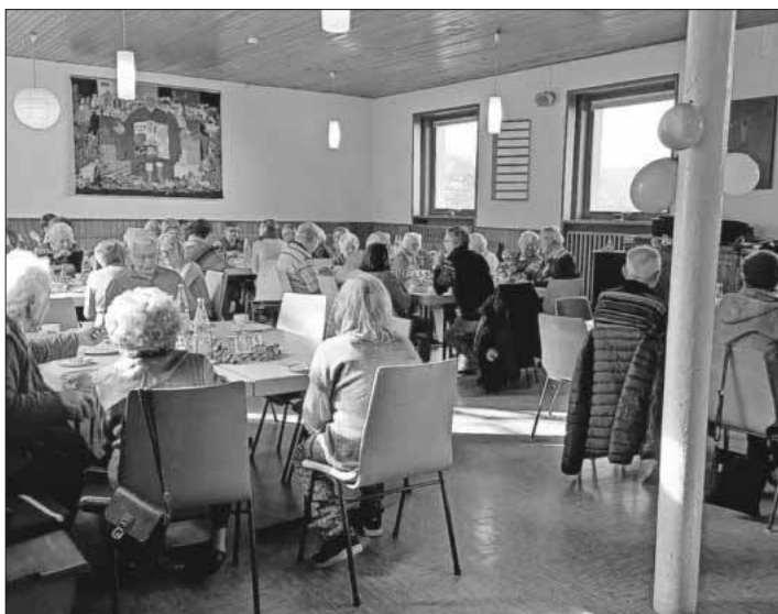
Der Gemeindegottesdienst war gut besucht.