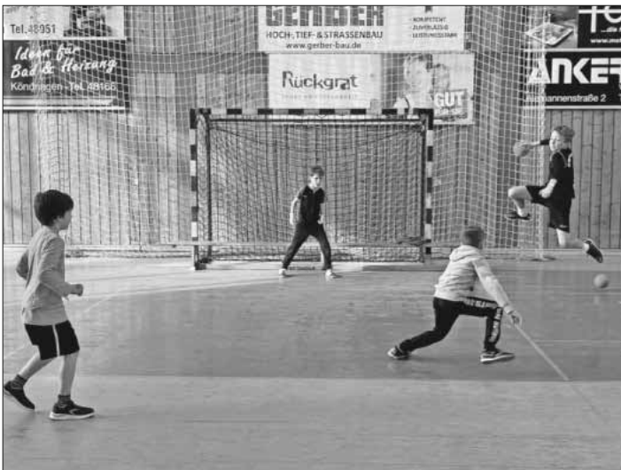
Die Kinder beim Handballtraining.

Das nächste Angebot von SpoFunnis wird das Hallenferienprogramm Sport&Fun in den Osterferien vom 2. bis 5. April sein. Teilnahmebeitrag mit leichter Erhöhung auf 7,50 Euro je Kind/Tag (Geschwisterkinder 7 Euro). Anmeldung ist ab sofort möglich unter 07641 / 9379999 oder spueo@spofunnis.de . Weitere Infos zu den SpoFunnis sind auf der Homepage www.spofunnis.de zu finden.