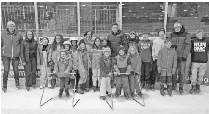
Die Jungmusiker der Musik- und Feuerwehrkapelle Teningen beim ersten Ausflug in diesem Jahr.

Wer auch Lust hat, in dem Verein gemeinsam Spaß zu haben, schaut doch mal auf der Internetseite www.mfk-teningen.de nach.