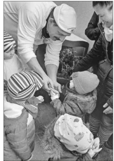
„Gizigrufen“ bei der Metzgerei Eisele.

Unter dem Lernfeld „Tradition und Brauchtum leben“ zogen die Kinder der Kita Dreikäsehoch am schmutzigen Dunschdig zum „Gitzig“-Umzug los. Ihre erste Station war die Dorfmetzgerei der Familie Eisele. Dort angekommen, führten die Kinder im Hof der Metzgerei zwei Bewegungstänze vor. Anschließend wurde das traditionelle „Gizigrufen“ veranstaltet. Zur Stärkung gab es danach von Familie Eisele eine leckere Wurst mit Brötchen.