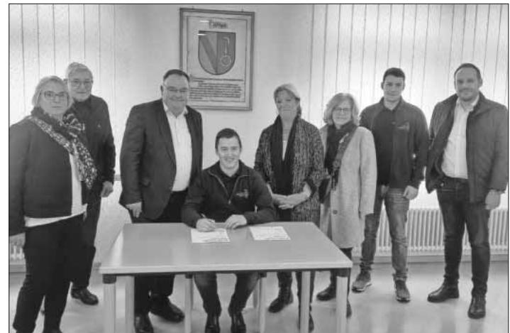
Ein wichtiger Baustein wurde gelegt: Die Beteiligten haben die Urkunde zur Musikpatenschaft unterschrieben.