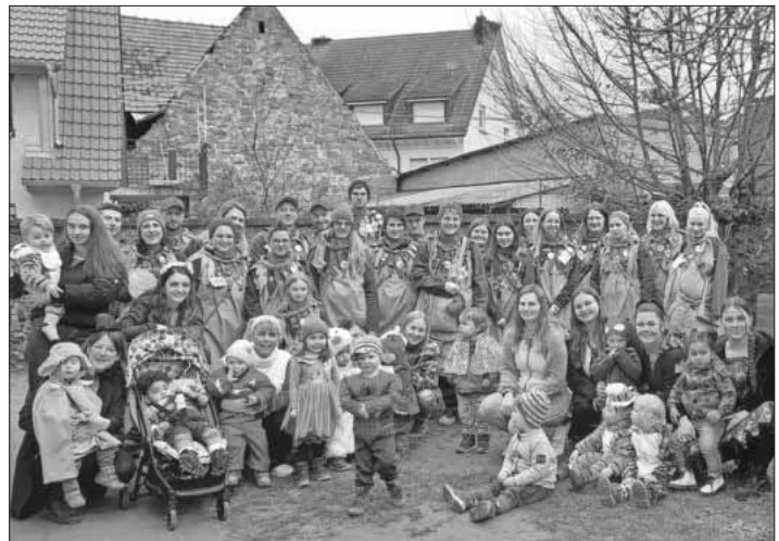
Besuch der Ruäbsäck im Dreikäsehoch-Garten.