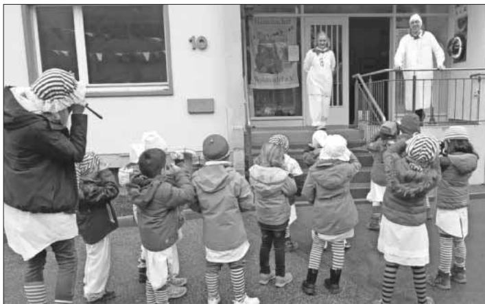
„Gizig“ rufen am Rathaus Heimbach.

Weiteres kann man Ende März in dieser Rubrik erfahren.