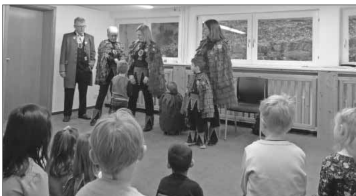
Waldteufelbesuch im Kindergarten.