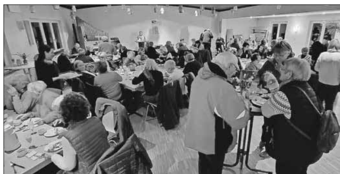
Nach dem Gottesdienst wurden im Gemeindehaus kulinarische Spezialitäten angeboten.