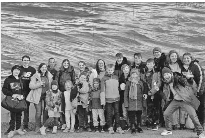
Blockflötenkinder, Jungmusiker und die „Däninger Nachwuchsmusikanten“ hatten großen Spaß beim gemeinsamen Ausflug ins Badeparadies Schwarzwald.

Dort konnten sich die Kinder, Jugendlichen und Junggebliebenen auf den 23 verschiedenen Rutschen und im Wellenbad austoben. Nach Currywurst mit Pommes frites fand man Entspannung in der Palmenoase bei sprudelndem Wasser, Cocktails und Softdrinks an der Bar im Wasser oder in der Dampfsauna. Nach einigen Stunden rutschen, schwimmen, springen, Ballspielen, ausruhen, wieder rutschen ... ging es abends wieder gemeinsam auf den Heimweg. Die begeistertesten Kinder wurden zu Hause abgeliefert und freuen sich schon auf den nächsten Ausflug. Weitere Informationen zur Jugendarbeit findet man unter www.mfk-teningen.de .