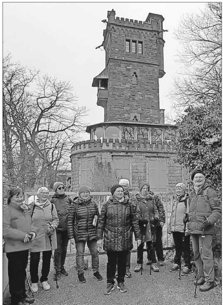
Die Wandergruppe vor dem Hilda-Turm.

Wanderstart war im Stadtteil Vauban mit dem Solarschiff und den Plusenergie-Siedlungshäusern, weiter zum Schlierberg mit dem Heliotrop und dem Weinbauinstitut bergan auf den Lorettoberg. Einige Gründerzeit-Villen, die nach 1900 von Studentenvereinigungen (Burschenschaften) erbaut wurden, konnte man noch sehen. Der Hildaturm, erbaut für Großherzogin Hilda von Baden, und danach das Loretto-Schloss und die Lorettokapellen wurden besichtigt. Nach der Einkehr in dem historischen Schlossrestaurant ging der Weg bergab vorbei am alten Steinbruch aus dem 13. Jahrhundert und dem Lorettobad zur Basler Straße. Mit der Straßenbahn ging es dann zum Holzmarktplatz mit der Info zur Schneckenvorstadt, weiter mit Mehlwaage und den Unigebäuden, erbaut ab 1896 KG 1 und KG 2, in dem Turm waren die Karzer untergebracht, welche noch zu besichtigen sind. Durch das Unigelände mit Peterhof, dem Stadtquartier des Klosters St. Peter und dem Haus zur lieben Hand, das Stadtquartier von Kloster St. Trudper und Kloster St. Gallen, wurde der Jesuitische Teil der Universität von ab 1620 mit der Jesuiten-Kirche mit Kreuzgang besichtigt. Der Abschluss war eine sehr informative Führung durch das Uniseum mit der Geschichte der Universität Freiburg.