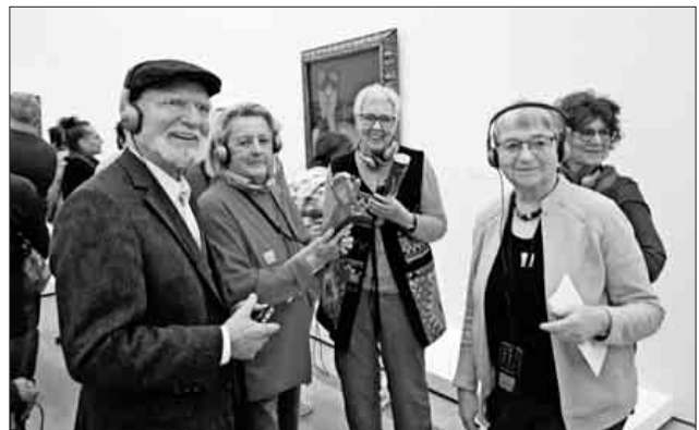
Die Teilnehmer genossen den dreistündigen Aufenthalt im Beyeler Museum.