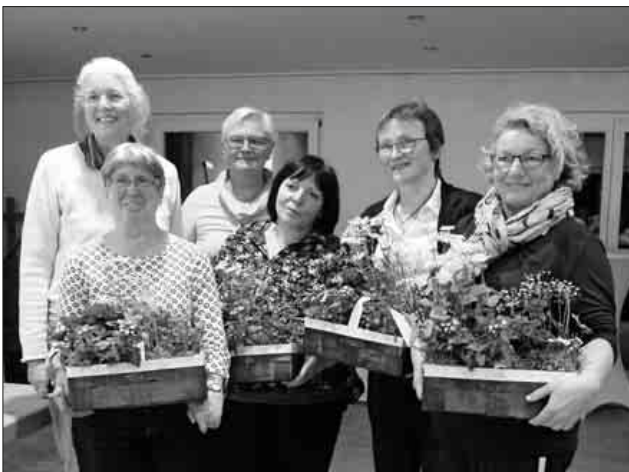
Das neue Vorstandsteam.