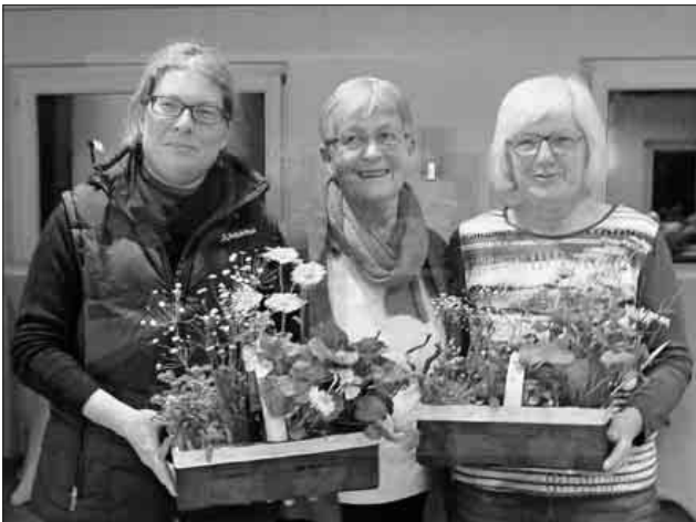
Die bisherigen Vorstandsfrauen wurden verabschiedet.

Nach dem offiziellen Teil waren alle Anwesenden zu einem Imbiss eingeladen.