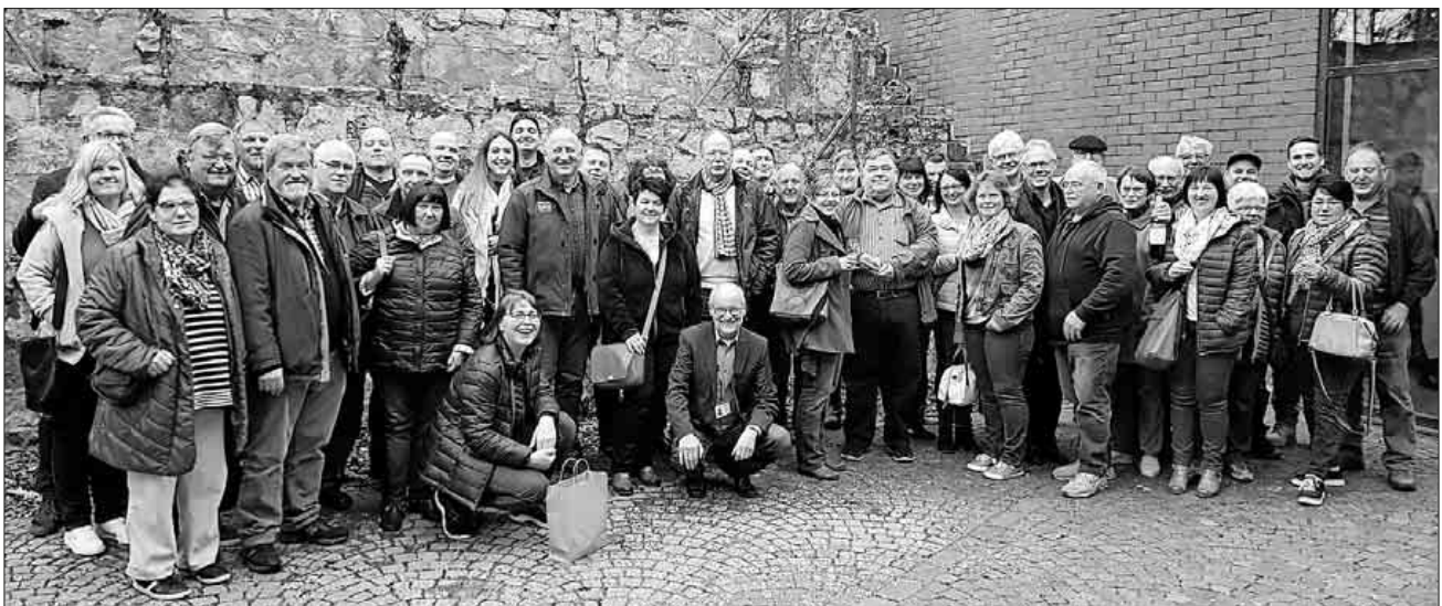
Einige Winzer der WG Köndringen nahmen an der Jungweinprobe in Breisach teil.