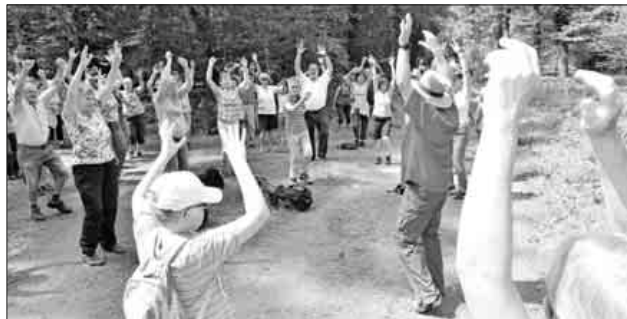
Lockerungsübungen in der Teningen Allmend.

Das Teningen Rote Kreuz bietet in Kooperation mit der Volkshochschule Emmendingen ab Dienstag, 7. Mai, fünfmal diens-tags von 9.30 bis 11.30 Uhr Gesundheitswanderungen an. Anmeldung unter Telefon 07641 / 92250, Treffpunkt: Parkplatz Trimm-dich-Pfad, Teningen Allmend.