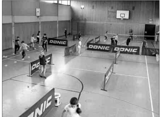
Den Klassen 1 bis 3 wurde an verschiedenen Stationen den Umgang mit Schläger und Tennisbällen beigebracht.

Die Grundschule Köndringen und die „Tennischule Vision-sport“, angeregt durch den TC Heimbach, organisierten mit den Klassen 1 und 2 sowie Klasse 3 ein Sportangebot der anderen Art. Unter der Anleitung des Tennistrainers Roberto Piluso, konnten die Schülerinnen und Schüler an mehreren Stationen den Umgang mit Schlägern und Tennisbällen ausprobieren und kennenlernen. Mit viel Spaß und Bewegung beim Tennisspielen ging die Sportstunde viel zu schnell vorbei. Weitere Aktionen sind angedacht.