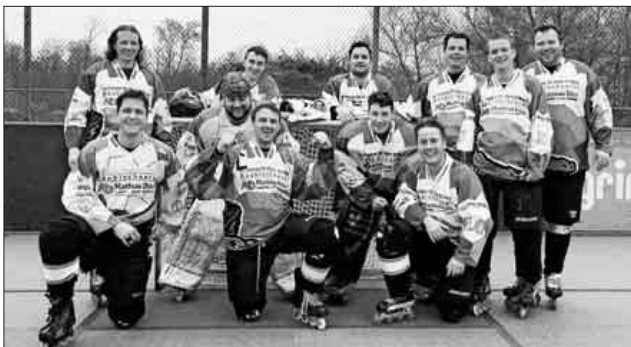
Siegreiche Herrenmannschaft am 14. April in Nimburg.

Das nächste Heimspiel findet am 4. Mai um 16.30 Uhr gegen Winnenden statt.