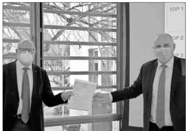
594.000 Euro für die Kläranlage Teningen-Köndringen: Regierungsvizepräsident Klemens Ficht (links im Bild) übergibt Oberbürgermeister Stefan Schlatterer der Zuwendungsbescheid.

„Die Modernisierung der Verbandskläranlage Teningen-Köndringen ist eine vorbildliche Investition für den Gewässer- und Umweltschutz in der Region, die das Land gerne fördert“, sagte Klemens Ficht und bedankte sich bei Oberbürgermeister Schlatterer für das Engagement. Die Wasserqualität des Mühlbachs werde künftig von den geringeren Nährstoffeinträgen der Kläranlage profitieren. Reduziert werde insbesondere der Eintrag von Phosphor: „Zu viel Phosphor im Gewässer verschlechtert die Wasserqualität, nährstoffliebende Pflanzen und Algen nehmen zu und die Anzahl der Tier- und Pflanzenarten sinkt.“ Das Umweltministerium Baden-Württemberg hat für Maßnahmen zur Reduzierung von Phosphor-Einträgen ein Sonderförderprogramm aufgelegt, von dem nun auch der Abwasserzweckverband Untere Elz profitiert. Der Abwasserzweckverband Untere Elz betreibt die Verbandskläranlage Teningen-Köndringen seit 1959. Die Anlage behandelt die Abwässer der Stadt Emmendingen sowie der Gemeinden Sexau und Teningen. Die gereinigten Abwässer von aktuell rund 40.000 Einwohnerinnen und Einwohnern werden in den Mühlbach eingeleitet. Da die bestehende Reinigungsleistung für diese Belastung rechnerisch nicht mehr ausreicht, wird die Anlage komplett modernisiert und erweitert. In den kommenden Jahren soll die komplette Kläranlage neu gebaut werden. Danach ist die Ausrüstung der Kläranlage mit einer vierten Reinigungsstufe zur Elimination von Spurenstoffen vorgesehen.