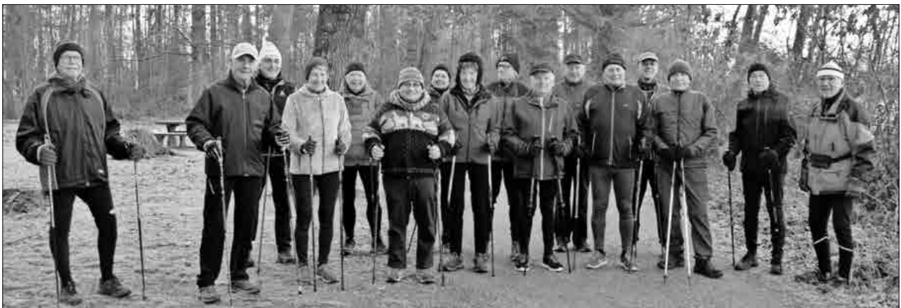
Begeisterte Teilnehmer der Freitags-Freizeit-Gruppe (FFG) geben sich am Teninger Maiwäldle ein Stelldichein.