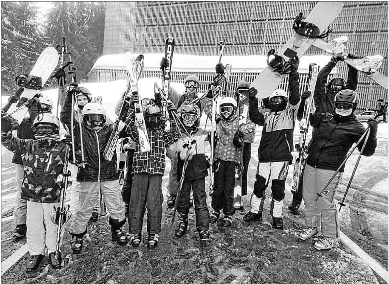
Ski und Rodel gut im Spofunnis Wintercamp 2018.

Unter diesen Kontaktdaten können auch weitere Infos erfragt werden. Bitte dazu auch die Internetseite von SpoFunnis www.spofunnis.de beachten.