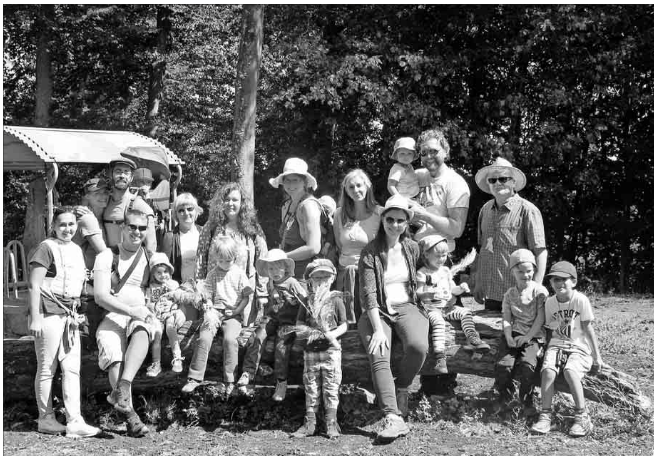
Junge Familien geben sich nach dem Rundgang auf der Viehweide Schelingen ein Stelldichein.