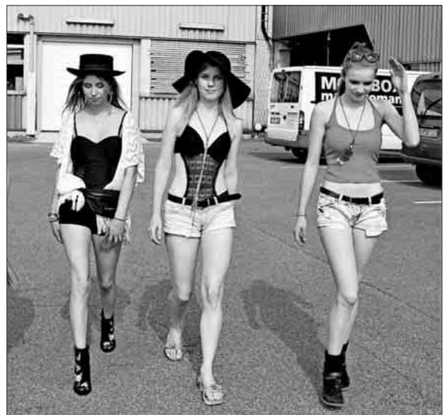
Catwalk auf dem Industriegelände.

Weitere Infos finden sich auf der Homepage der Gemeinde Teningen oder unter @kjbteningen Facebook.