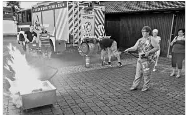
Für alle war das Löschen mit einem Feuerlöscher das erste Mal.