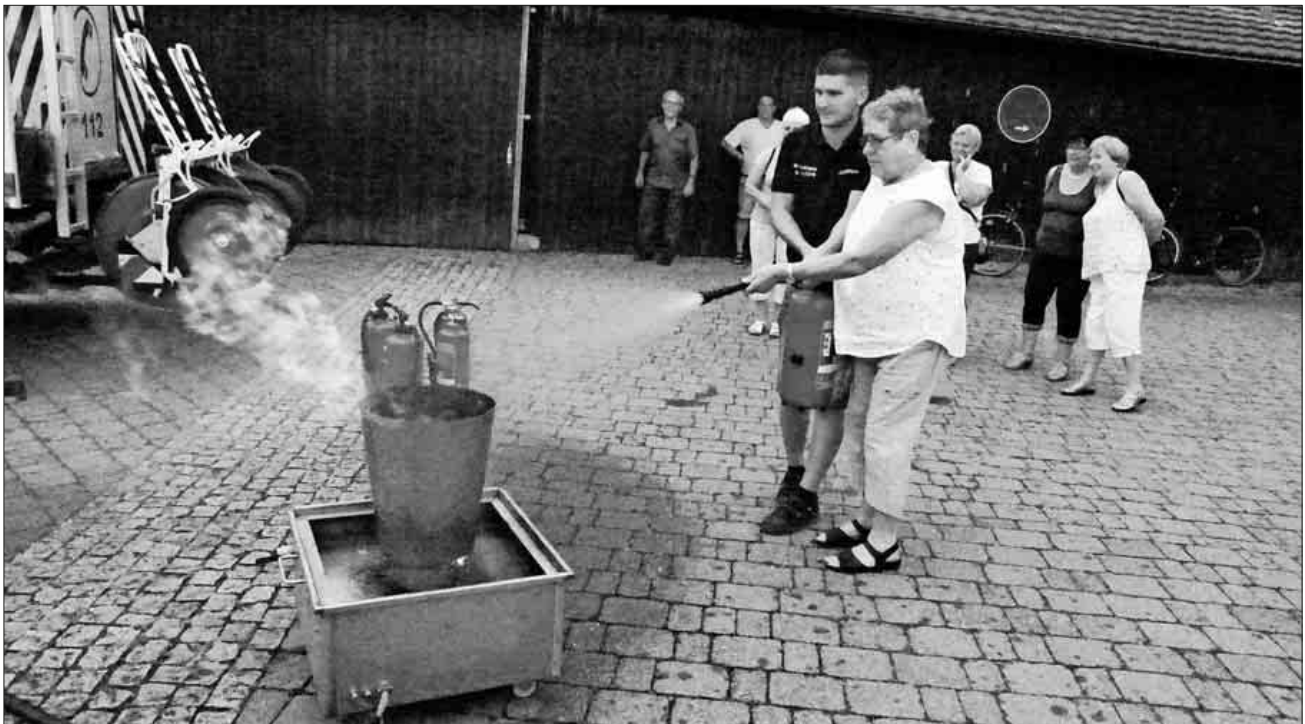
Vor der Praxis zunächst die Theorie.