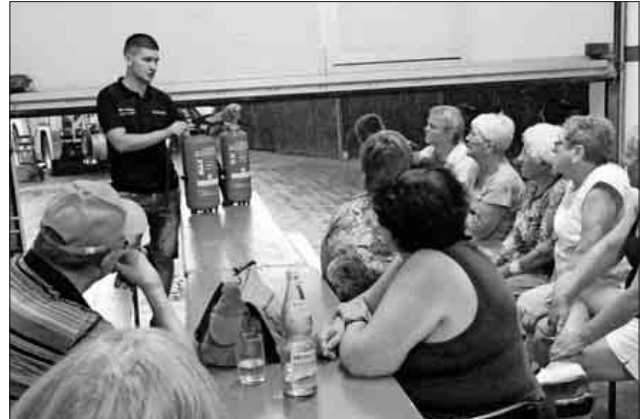
Jeder durfte sich mal als Löschmeister beziehungsweise als Löschmeisterin versuchen.