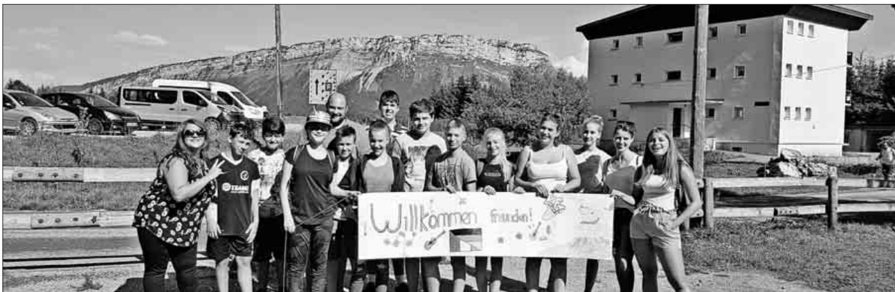
Die Kinder und Jugendlichen erlebten eine Sommerferienfreizeit der etwas anderen Art.

Ein herzlicher Dank geht an die französischen Fachkräfte aus La Ravoire, die den Großteil der Planung und Organisation übernommen haben. Weiterhin wird dem Deutsch-Französischen Jugendwerk gedankt, welches diese spannende deutsch-französische Begegnung unterstützt und gefördert hat.