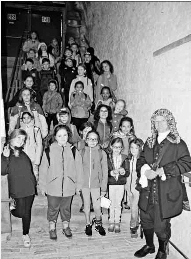
Die Klasse 4b und der Festungsbaumeister Herr Vauban.

In Neuf Brisach stand nun eine zweisprachige Führung durch die beeindruckende „Festung“ auf dem Programm. Dabei stand natürlich ein uns nicht ganz unbekannter Festungsbaumeister Herr Vauban im Vordergrund, aber auch der Ingenieur Tulla wurde aufgrund der Rheinbegradigung genannt. Eine gemeinsame Schatzsuche rundete das Programm ab, jeder Schatzsucher bekam als Belohnung eine Goldmünze.