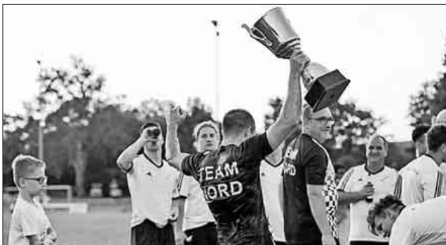
Pokalfeier Derbysieger Nord

im Norden mit einem Einweihungsfeuerwerk neben dem neuen Köndringer Wahrzeichen, dem Hollywood ähnlichen „Nord“-Schriftzug am Hungerberg, und mit einer Party an der Elzdammbar gebührend gefeiert.