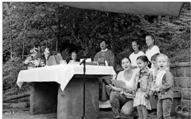
Der Gottesdienst des Schapbacher Schwarzwaldvereins.