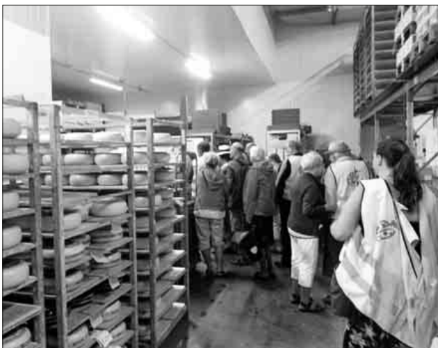
Besuchergruppe in der Käserei

Im nahegelegenen Café Mitnander waren Plätze reserviert und der Nachmittag konnte bei Kaffee, Kuchen und Eis gemütlich ausklingen.