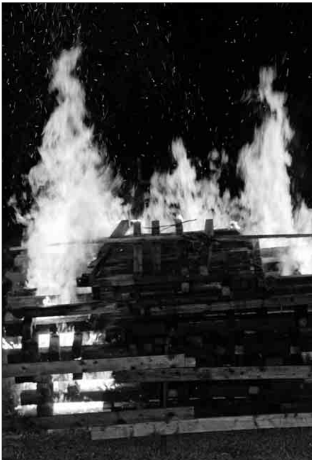
Das Sonnwendfeuer und der Gottesdienst prägten die Sonnwendfeier des Schapbacher Schwarzwaldvereins auf dem Kupferberg.