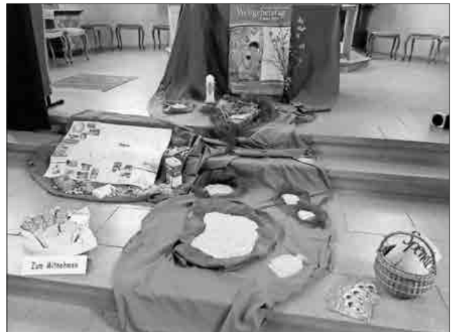
Auch in der Heimbacher Kirche gab es zum Weltgebetstag die Stoffinseln.

In über 150 Ländern der Erde wurde am Freitag, 5. März, der ökumenische Weltgebetstag der Frauen auf vielerlei Weise gestaltet. In den Teningen Kirchen wurde der Inselstaat Vanuatu (östlich von Australien gelegen) durch liebevoll gerichtete Stoffinseln lebendig. Die Kernbotschaft der Frauen aus Vanuatu ist ein Zitat von Jesus: „Tut anderen das, was ihr selbst wollt, das man euch tut“. Damit kommt die Hoffnung zum Ausdruck, dass alle Menschen gleichberechtigt sind und ein respektvolles und solidarisches Zusammenleben in der Gesellschaft, ob im Breisgau oder in Vanuatu, Wirklichkeit wird.