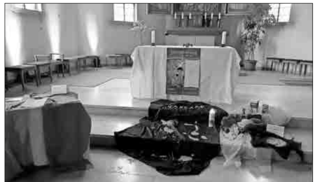
Die Stoffinsel in der Kirche St. Marien in Köndringen.

» Was Sie interessiert, ist für uns wichtig.