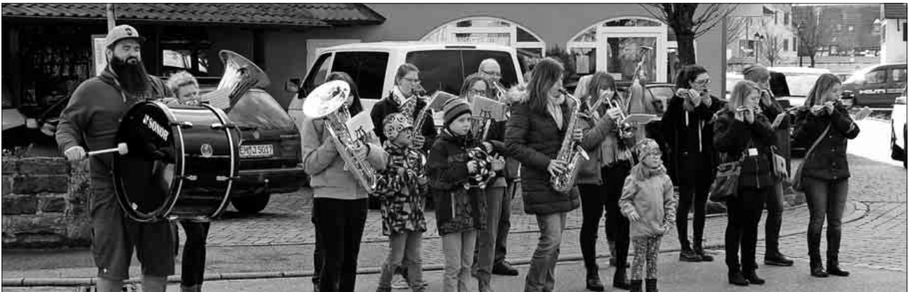
Der Spielmanns- und Musikzug der Feuerwehrabteilung Köndringen sorgte wieder für die stimmungsvolle musikalische Umrahmung.