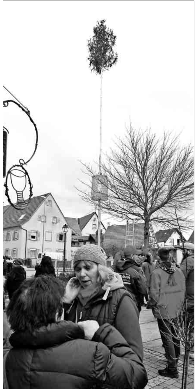
Der Baum steht, jetzt geht's los.