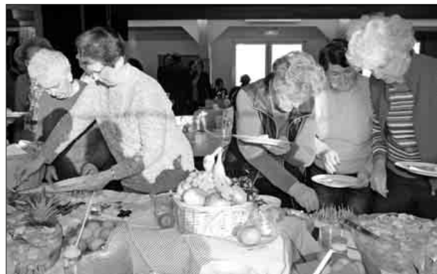
Ein vollkommenes Frühstück in unterhaltsamer Atmosphäre schmeckt noch mal so gut.