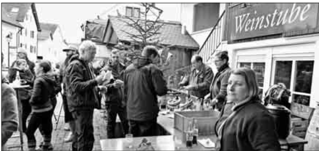
Dass die Narren weder hungern oder gar verdursten mussten, dafür sorgte zuverlässig das „Weinstube“-Team.

In zwei Wochen kann es dann so richtig losgehen, die Vorbereitungen für das große Jubiläumswochenende sind in der Endphase, der Startschuss ist gefallen. Info: www.ruaebsack.de .