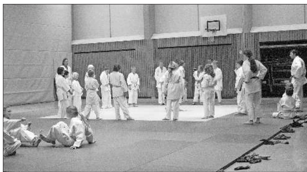
Lust auf Judo?

Wer Lust auf mehr bekommen hat, erhält weitere Infos über die Judoabteilung unter www.tus-teningen.de . Man freut sich auf jeden ... es begrüßt die Judoabteilung des TuS Teningen.