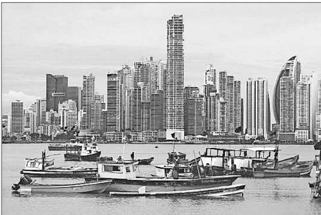
Die Skyline von Panama.

Am kommenden Sonntag, 25. September , findet aus diesem Grund eine Präsentation in der Zehntscheuer der Gemeindebücherei statt. Alle Interessierten sind herzlich eingeladen, sich auf den Weg zu machen das Land und die Kultur des 3,3 Millionen Einwohner zählenden Staates kennenzulernen. Die Besucher des Vortrages können sich auf tolle Geschichten, imposante Bilder und einen landestypischen Gaumenschmaus freuen. Der Eintritt ist kostenlos. Beginn ist um 17 Uhr.