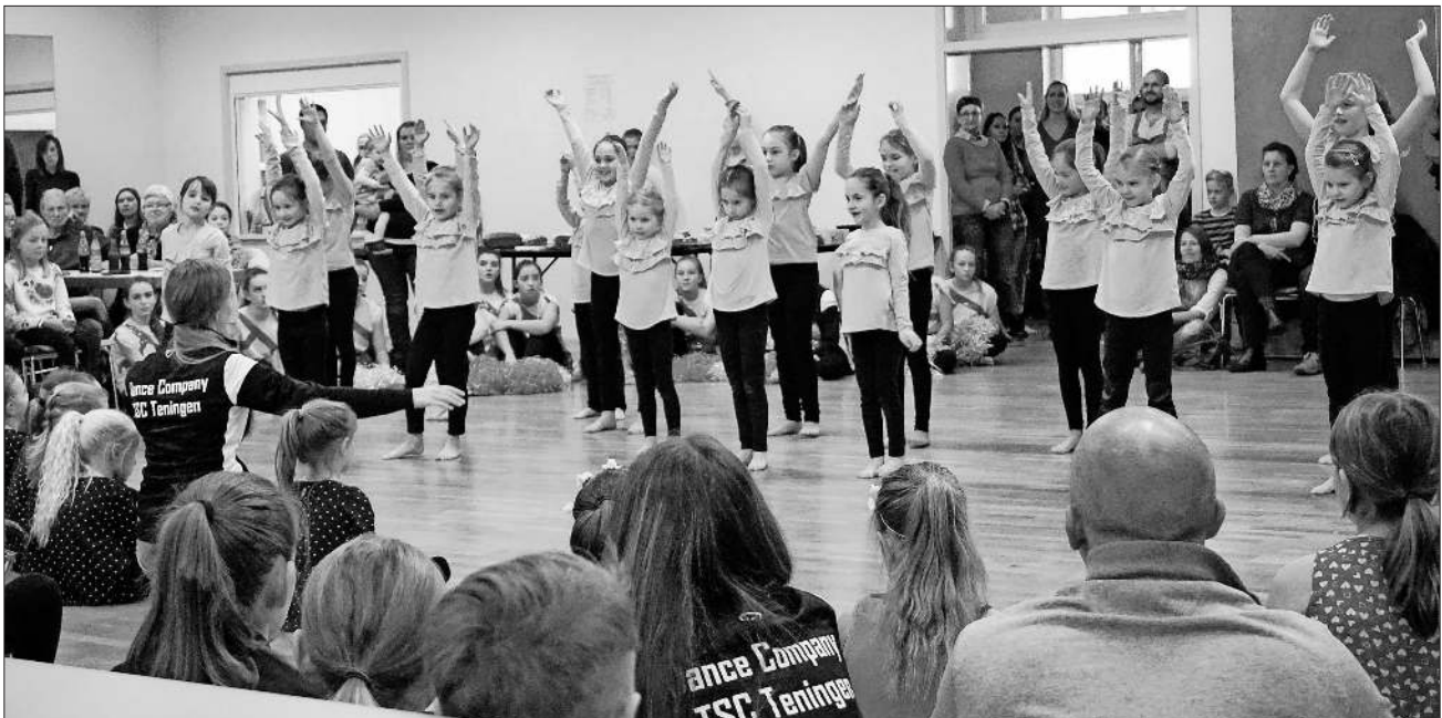
Mit Konzentration waren auch die kleinen Tänzerinnen bei der Sache.

Zum Dank für die gelungenen Aufführungen erhielten alle Tänzerinnen kuschelige Socken und einen kräftigen Applaus. Und auch die fünf Trainerinnen bekamen für ihr zauberhaftes Programm Blumen überreicht. Dann wurde es noch einmal turbulent, als sich alle Tänzerinnen auf der Tanzfläche versammelten und gemeinsam zu „Christmas Time“ tanzten.