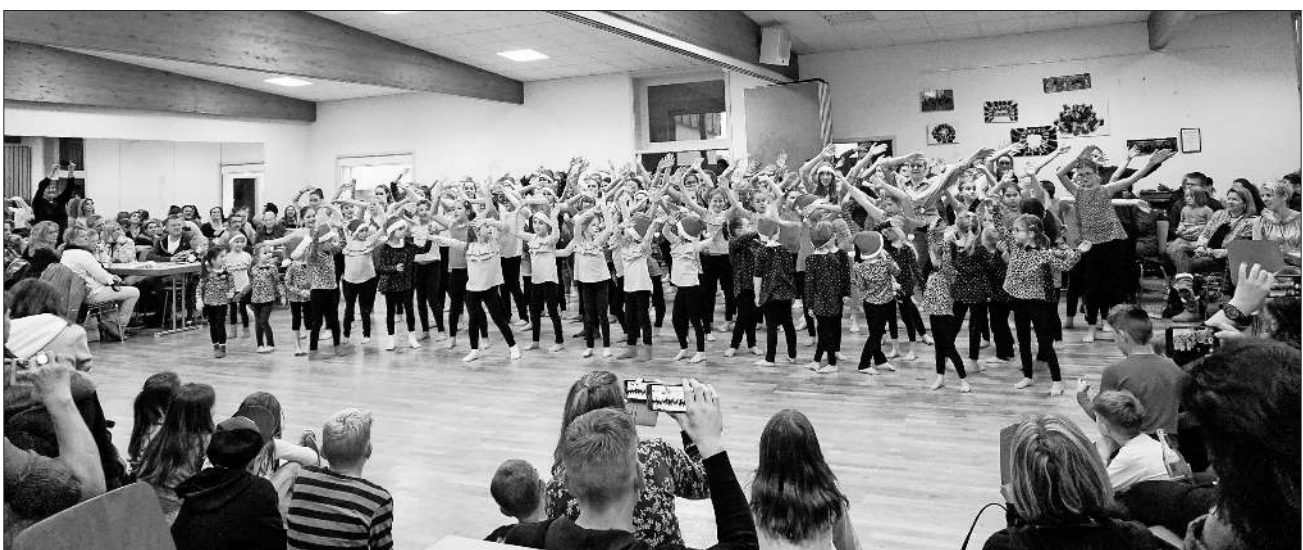
Alle Tänzerinnen versammelten sich auf der Tanzfläche und tanzten gemeinsam zu „Christmas Time“.