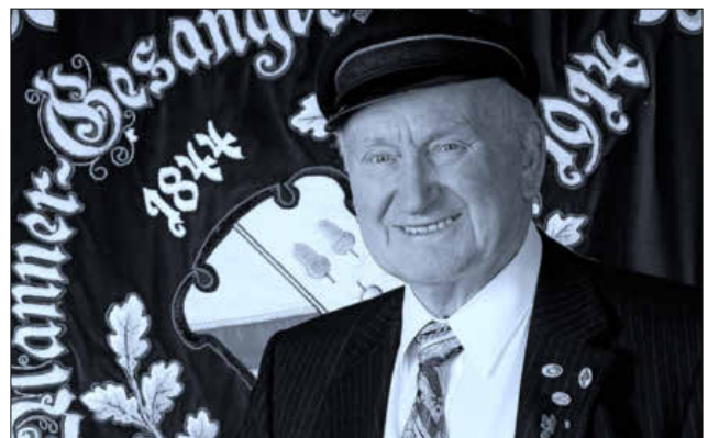
Zu seiner 65-jährigen Chormitgliedschaft schenkte ihm die Chorgemeinschaft Nimburg ein professionelles Foto der Fotografin Sylke Neuhäuser.