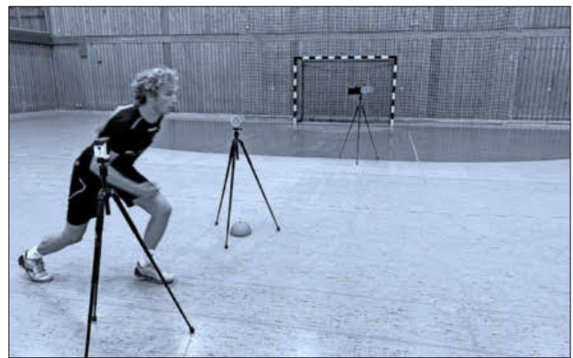
Mithilfe verschiedener Lichtschrankensysteme wurden Sprint- und Reaktionswerte ermittelt.

Weitere Informationen zur Vorbereitung der einzelnen Teams und dem Geschehen rund um die SG Köndringen/Teningen gibt es in regelmäßigen Abständen auf der Homepage und den Socialmedia Kanälen.