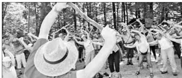
Physiotherapeutische Übungen in der Teningen Allmend - ein Erlebnis für Körper, Geist und Seele.

Das Teningen Rote Kreuz bietet in Kooperation mit der VHS ab 7. Mai fünfmal dienstags von 9.30 bis 11.30 Uhr Gesundheitswanderungen an. Anmeldung unter Tel. 07641 / 92250, Treffpunkt Parkplatz Trimm-dich-Pfad, Teningen Allmend.