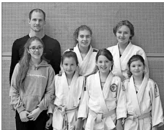
Die Judoka bei Jugend trainiert für Olympia.

Der TuS Teningen wünscht allen Judoka weiterhin faire und verletzungsfreie Wettkämpfe. Ein Dankeschön auch für die gute Zusammenarbeit zwischen der Schule und der Judoabteilung des TuS Teningen.