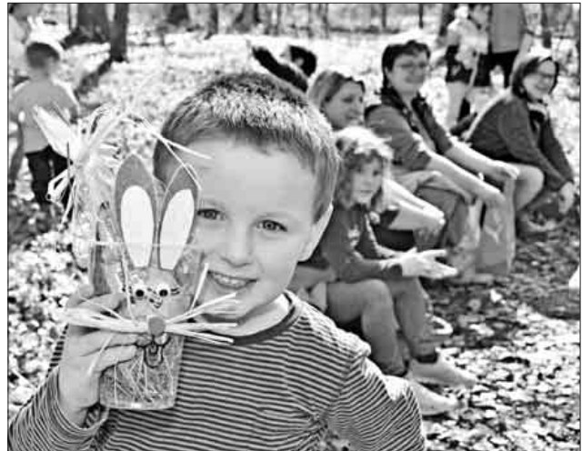
Jedes Kind darf eine Osterüberraschung mit nach Hause nehmen.

Kuchenspenden sind erwünscht. Verbindliche Anmeldung nehmen Hildegard und Kurt Armbruster bis Freitag, 23. März, unter der Telefonnummer 07641 / 47559 entgegen (nach 18 Uhr).