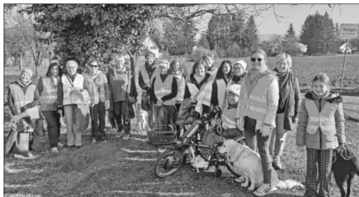
Der Popchor „sing4fun“ des Gesangvereins Teningen bei der diesjährigen Dorfputzede.

Am vergangenen Samstag, 9. März, beteiligte sich der Popchor sing4fun beinahe vollzählig bei der diesjährigen Dorfputzede. Bei bestem Wetter wurde mit Müllbeuteln und Greifzangen die Umgebung rund um die L 114 von Abfall und Müll befreit. Anschließend wurde gemeinsam der Ostermarkt besucht und nach gutem Essen und Trinken die Aktion beendet. Eigentlich hätten die Sängerinnen des Chors sagen können, die Aktion hat Spaß gemacht. Jedoch wurde am Parkplatz beim Teningen Baggersee ein kleiner toter Hundewelp in einem mit Sägespänen ausgelegten Schuhkarton gefunden. Dieser Fund war so erschreckend, dass dem Chor diese Dorfputzede immer in Erinnerung bleiben wird. Dennoch wird sich der Chor auch im nächsten Jahr wieder an dieser schönen und sinnvollen Aktion beteiligen, denn „wir können nicht nur singen ...!“.