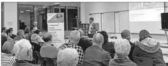
Die Veranstaltung der Nahwärmeversorgung Teningen GmbH war gut besucht.

Weitere Informationen und die Ausbaukarte findet man auf der Webseite: www.nahwaerme-teningen.de .