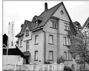
Außenansicht des Rebay-Hauses in Teningen, Emmendinger Str. 11

als Leihgaben für ein Jahr aus New York. Das großformatige Ölbild, das eine wohlwollende Freiburger Kunstsammlerin ebenfalls zur Wiederöffnung als Leihgabe zur Verfügung stellte, beherrscht als Blickfang den großen Ausstellungsraum mit den gegenstandslosen Werken. Die Bemühungen um eine Verlängerung der Leihfrist waren erfolgreich – dieser Tage kam die Zusage der Verlängerung um ein Jahr. Die neueste Nachricht: Auch unsere Freiburger Leihgeberin, lässt, nach entsprechender Anfrage, ihr großes Gemälde zunächst bei uns. Das bedeutet, dass, mit den Leihgaben und deren effektvoller Hängung, ein Besuchermagnet für das Rebay-Haus erhalten bleibt!