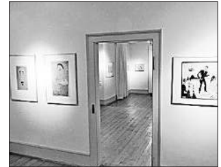
Innenansicht der Ausstellungenräume