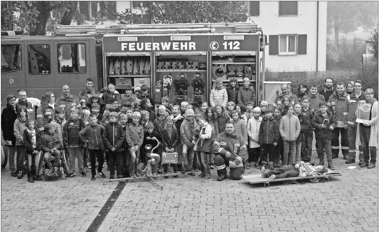
Die teilnehmende dritte und vierte Klasse der Nikolaus-Christian-Sander-Schule

Der Begeisterung nach zu urteilen mit dem die Schülerinnen und Schüler an diesem Aktionstag teilgenommen haben, dürfte man dem Ziel das Interesse am Helfen zu vermitteln und die Begeisterung an einer helfenden Jugendorganisationen zu wecken erreicht haben.