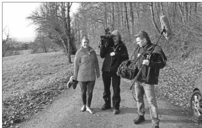
Das Drehteam des SWR-Fernsehens.

Der Beitrag wurde noch am gleichen Abend gesendet und ist nun auch über die Mediathek des Senders bis Dezember 2023 abrufbar. Er beginnt innerhalb der Sendung ab Minute 19:30 – kurz unterbrochen durch den Wetterbericht – und dauert insgesamt etwa fünf Minuten.