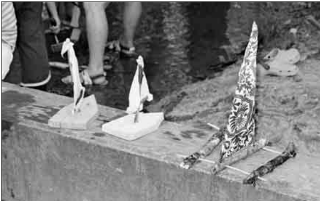
Unter anderem werden bei der Ferienpaßaktion auch Boote gebaut.

Anmeldung bis Dienstag, 30. Juli, unter Telefon 07641 / 47559 oder per E-Mail: kurt.armbruster@web.de.