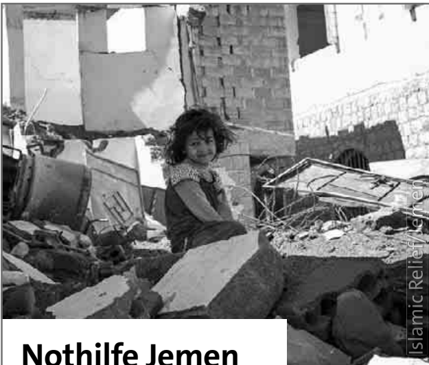
Islamic Relief Jemen

Über zahlreiche Besucher konnten sich die Dreikäsehochs bei ihrem diesjährigen Sommerfest in Köndringen freuen. Es wurde Einiges geboten für Groß und Klein: heiß begehrt waren die Tombolalose und das Fädenziehen, so viele tolle Preise ließen nicht nur die Kinderaugen strahlen. Beim Kinderschminken wurden sogar einige Erwachsene entdeckt und das Ponyreiten im Hohländle war natürlich wieder der Höhepunkt. Bei Kita-Rundgängen konnte man mehr über Räumlichkeiten und Konzept der Kindertagesstätte erfahren und Sinnesspiele für die kleinsten Besucher rundeten das Programm ab. Auch fürs leibliche Wohl war wieder bestens gesorgt, Corndogs, Tortilla und Würstle kamen sehr gut an, in entspannter Atmosphäre genossen die Gäste das schöne Wetter bei Kaffee und Kuchen. Alles in allem ein gelungener Festtag, wir danken allen fleißigen Helfern und Sponsoren, die dazu beigetragen haben.