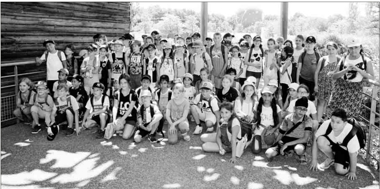
Abschlussfoto von den Austauschklassen.

Viel zu schnell ging der Vormittag vorbei, da blieb gerade noch Zeit für ein gemeinsames Abschlussfoto.