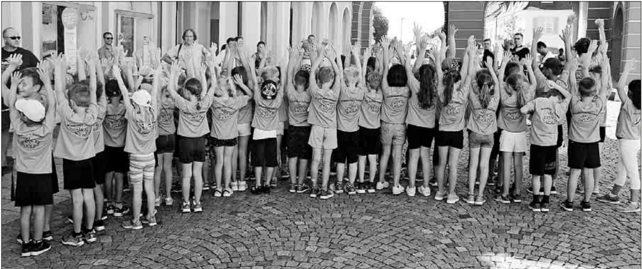
Die Schüler vor dem Start zum Stadtlauf.

Der schnellste Läufer der Schule legte die Laufrunde in 5:01 Minuten zurück. Am Jedermann-Lauf mit 4 km Länge starteten zwei Kollegen der Schule.