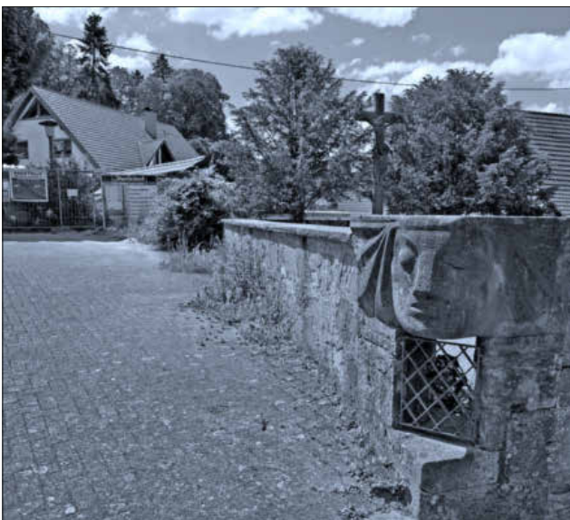
Gewünscht wird eine Aufstellung am Kirchenvorplatz.

Ferner wurde bekannt gegeben, dass die Themen der abgesagten Flurbegleichung an den Bauhof zur Bearbeitung weitergegeben wurden. Der Bauhof hat bereits drei weitere Stationen für Hundekotbeutel aufgestellt. Auf Anfrage eines Bürgers nach dem Friedhofskonzept wurde mitgeteilt, dass ein erster Entwurf vor Kurzem vorgelegt wurde, für den noch einige Vorklärungen erforderlich sind, bevor er vorgestellt werden kann. Dies soll so schnell wie möglich erfolgen.