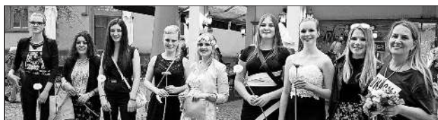
Eindrücke von der Modenschau 2015.

Am Freitag, 6. Mai, ist es wieder soweit: Emmendingen lädt ein zur verkaufsoffenen Nacht und Singarena 2016 und die Mädchen vom Projekt 2000 des Kinder- und Jugendbüros Teningen sind mit dabei. Angeleitet durch Elke Schweizer und Mitarbeiter des Modefachgeschäfts Tally Weijl werden sie die neue Sommerkollektion auf dem Laufsteg präsentieren. Los geht's am 6. Mai um 19.30 Uhr direkt vor dem Geschäft Tally Weijl (Kirchstraße 2A). Alle Interessierten sind dazu herzlich eingeladen.