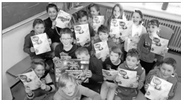
Die Schüler der Klasse 4b.

Unter allen Einsendungen wurden drei Gewinnerklassen mit ihren Ergebnissen ausgewählt und die Köndringer Abschlussklasse konnte als dritten Preis ein Elektroauto mit Solartankstelle zum Selberbauen von Ravensburger in Empfang nehmen. „Dass wir so erfolgreich sind, hätten wir nicht gedacht“, jubelten die Kinder. Die Urkunden werden demnächst mit der Post nachgeliefert.