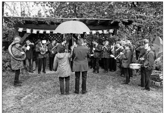
Der Musikverein Nimburg-Bottingen trotzte beim traditionellen Maispielen Wind und Wetter.

Glatterfest 2016: Das diesjährige Glatterfest findet vom 17. bis 19. Juni auf dem Parkplatz der Nimberghalle statt. Musikalisch mit an Bord ist dieses Jahr wieder die Band GinFizz Family sowie Musik- und Gesangsvereine aus der Region.