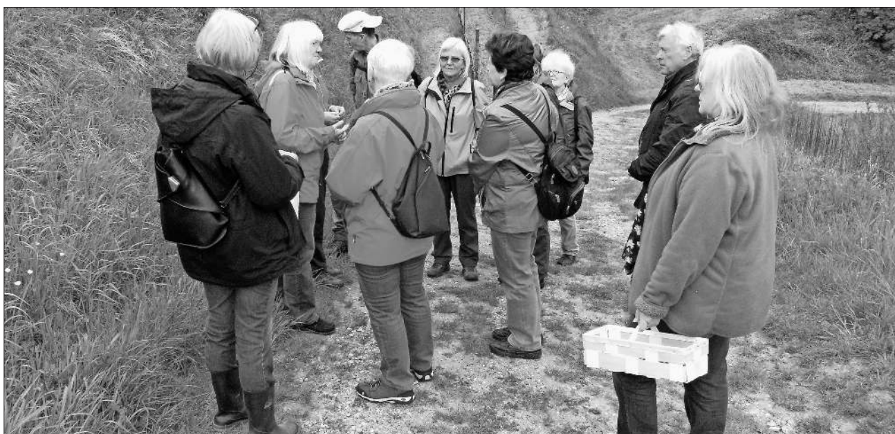
Kräuterwanderer auf dem Weg zur Amolterer Heide.