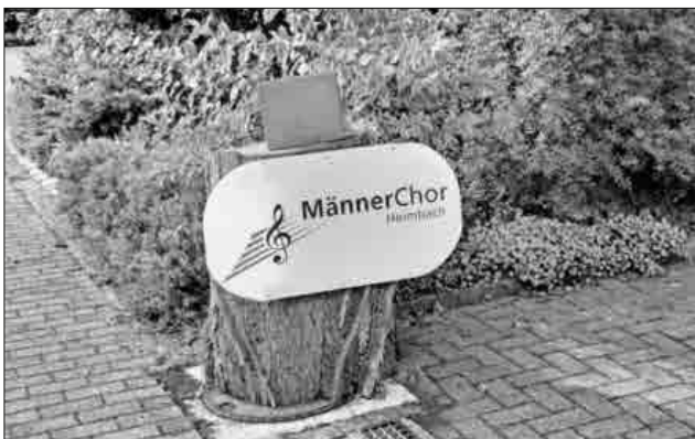
Anmelde-Briefkasten beim Anwesen Rinklin, Heimbach, Dreibrunnenstraße 6.

Einblicke und Informationen über die Aktivitäten des Chores finden sich unter auch www.Maennerchor-Heimbach.de .