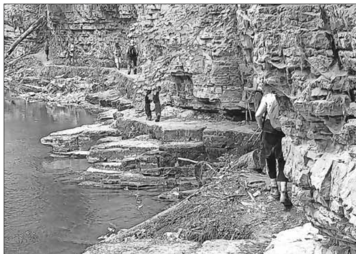
Wandern in der Schlucht erfordert gute Trittsicherheit

Maschinenhaus ein. Mit Wasserkraft wurden Pumpen angetrieben, die das 130 Meter höhergelegene Dorf mit Trinkwasser bis lange nach dem 2. Weltkrieg versorgte. Weiter ging es bei der Tränkebachmündung in die urige, dschungelartige Engeschlucht, die eine besondere Trittsicherheit und Schwindelfreiheit beanspruchte. Danach führte der elf Kilometer lange Weg mit 330 Höhenmetern wieder zurück zum Bahnhof.