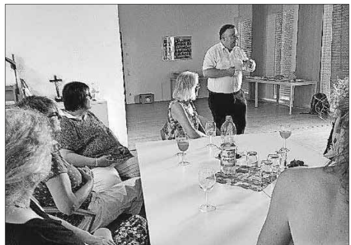
Bürgermeister Heinz-Rudolf Hagenacker bedankte sich im Rahmen des Treffens bei den engagierten Menschen der Nachbarschaftshilfe.

Aktuell umfasst der Helferkreis 30 ehrenamtliche Nachbarschaftshelferinnen und -helfer. Diese Nachbarschaftshelferinnen und -helfer unterstützen rund 35 Menschen bei der Bewältigung des Alltags.