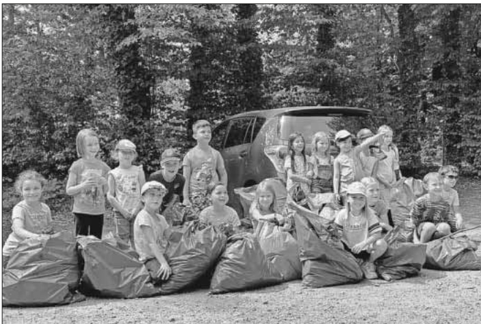
Die Kinder mit dem eingesammelten Müll