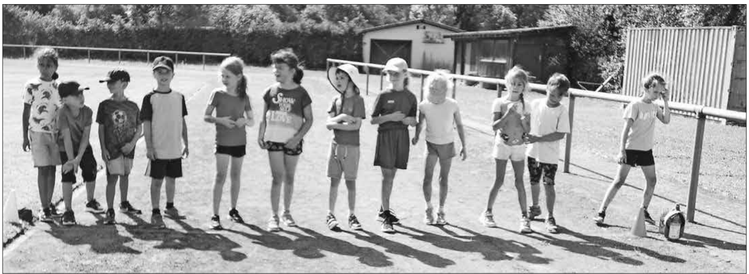
Die Kinder an der Startlinie.