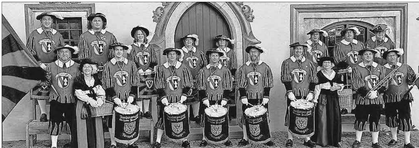
Der Teninger Fanfarenzug

Dieser Auftritt war wieder einmal sehr interessant und unvergessen. Dies kann allerdings nur bewältigt werden, wenn die notwendige Mitgliederstärke zustande kommt. Der Teninger Fanfarenzug ist dringend auf der Suche nach Mitgliedern, um weiterhin im In- und Ausland solche Auftritte wahrnehmen zu können. Egal, ob Jung oder Alt oder Ehemalige, es sind alle herzlich willkommen. Das Erlernen einer Fanfare oder Trommel ist nicht schwer. Wer Interesse hat, kann immer montags ab 20 Uhr im Atrium der Theodor-Frank-Schule vorbeischauen. Der Fanfarenzug würde sich sehr freuen.