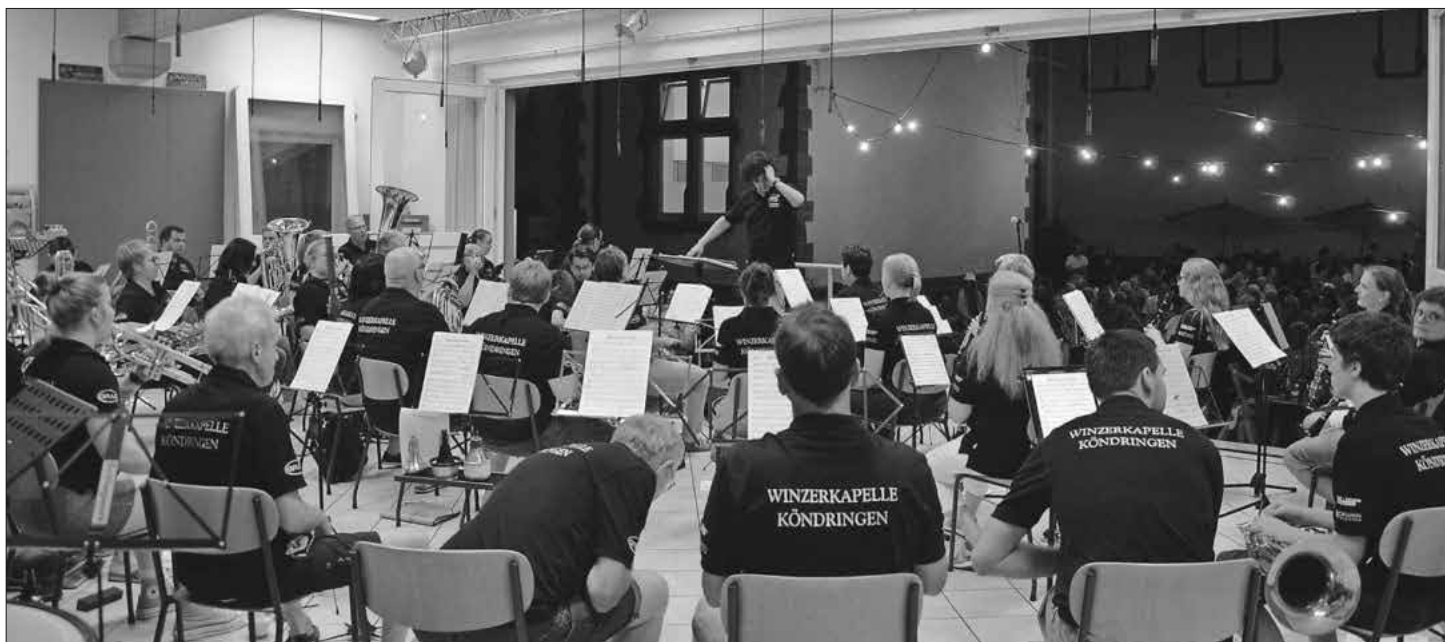
Das Symphonische Blasorchester