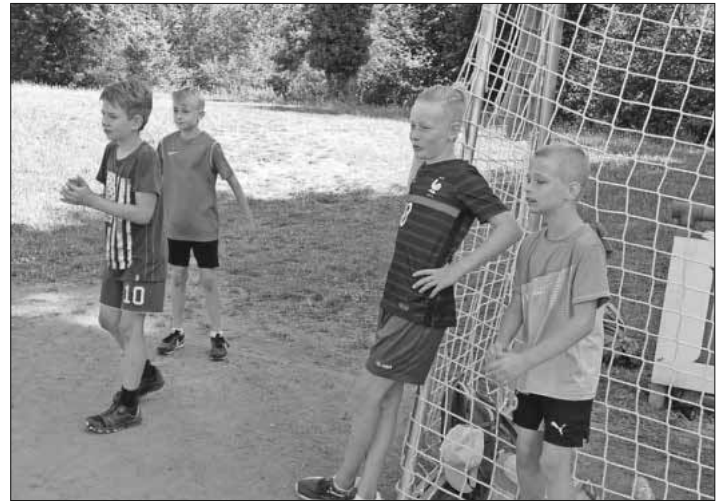
Im Schatten haben die Kinder sich erholt.

Müde, verschwitzt und zufrieden ging es schließlich zurück zur Schule, wo als krönender Abschluss die Glocke des Eiswagens erklang und sich alle Sportler und Sportlerinnen eine wohlverdiente Kugel Eis abholen konnten.