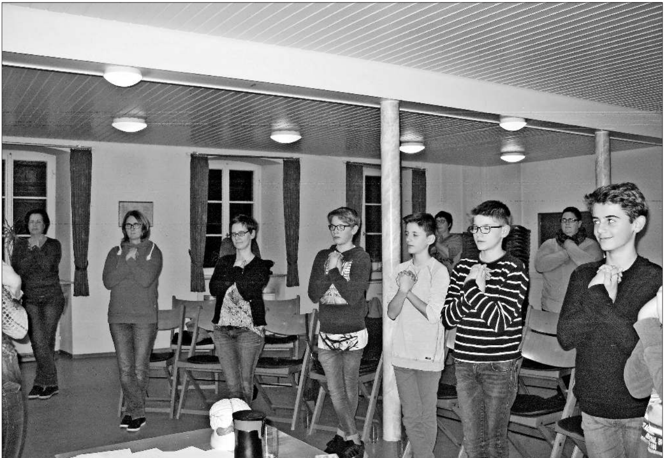
Am Ende des Vortrags das „Hook up“, die Entspannungsübungen.

Als Fazit kann man festhalten: Kinesiologie kann eine gute Möglichkeit für eine höhere Konzentration beim Lernen und Arbeiten sein, jedoch keinesfalls als Druckmittel für noch mehr Leistung herhalten.