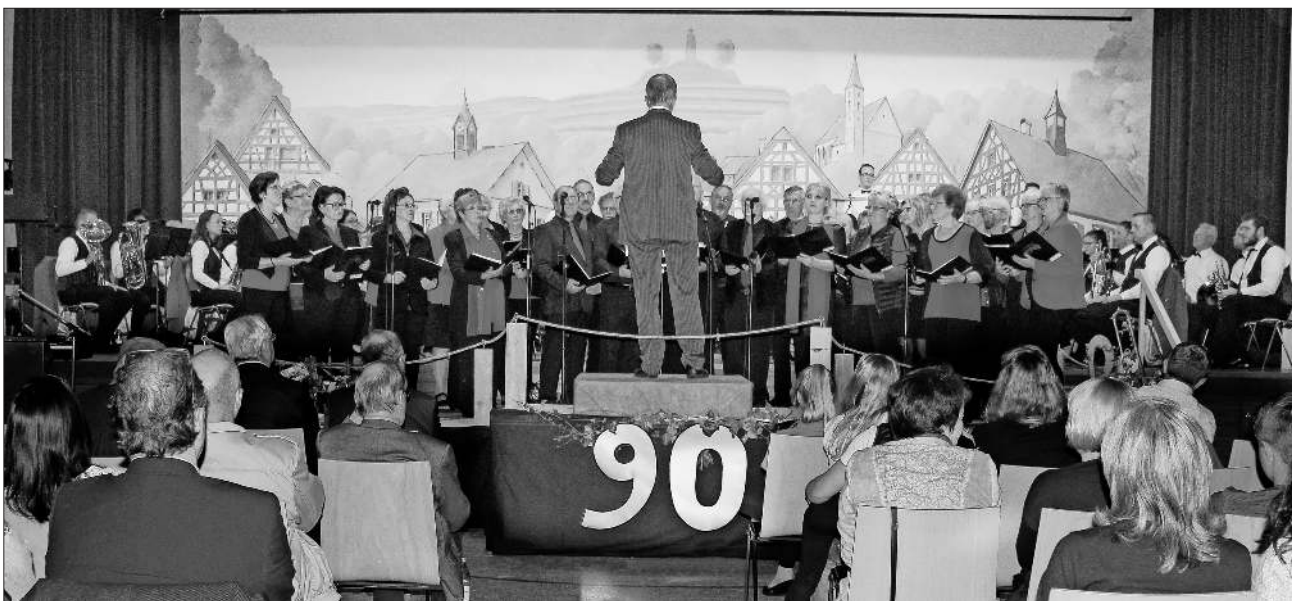
Die Kapelle bot begeisternde Musik.

Ein krönendes Finale des ganz besonderen Abends stellten die gemeinsam von Musikverein und Chor vorgetragene Stücke „Conquest of Paradise“ und „Die Gedanken sind frei“. Das Publikum applaudierte begeistert und ein gemeinsam gesungenes „Badnerlied“ beendete den reichhaltigen Konzertabend. Zum Ausklang des Abends konnte bei Musik der DJs „Bärenbrüder“ das Tanzbein geschwungen werden.