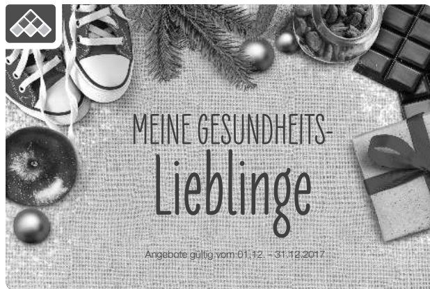
Angebote gültig vom 01.12. - 31.12.2017

An dieser Stelle recht herzlichen Dank an die Metzgerei Feißt, die den Stammtisch bei seinen Treffen immer bestens versorgt.