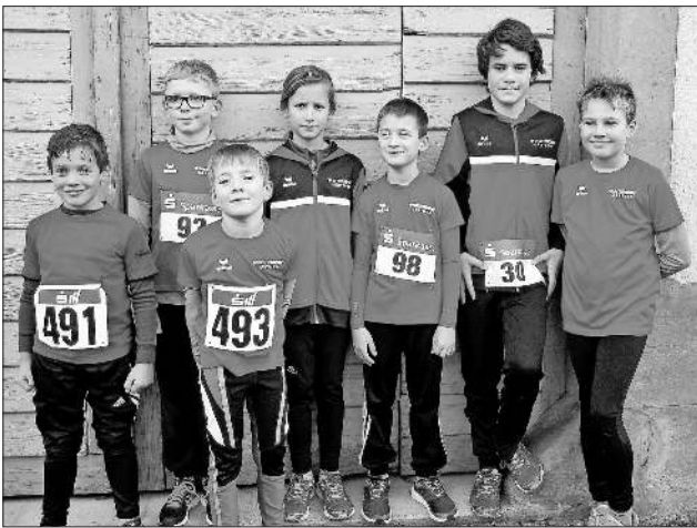
Die erfolgreichen Läufer.

Die Crosslaufserie wird mit dem Lauf in Pfaffenweiler am 16. Dezember abgeschlossen.