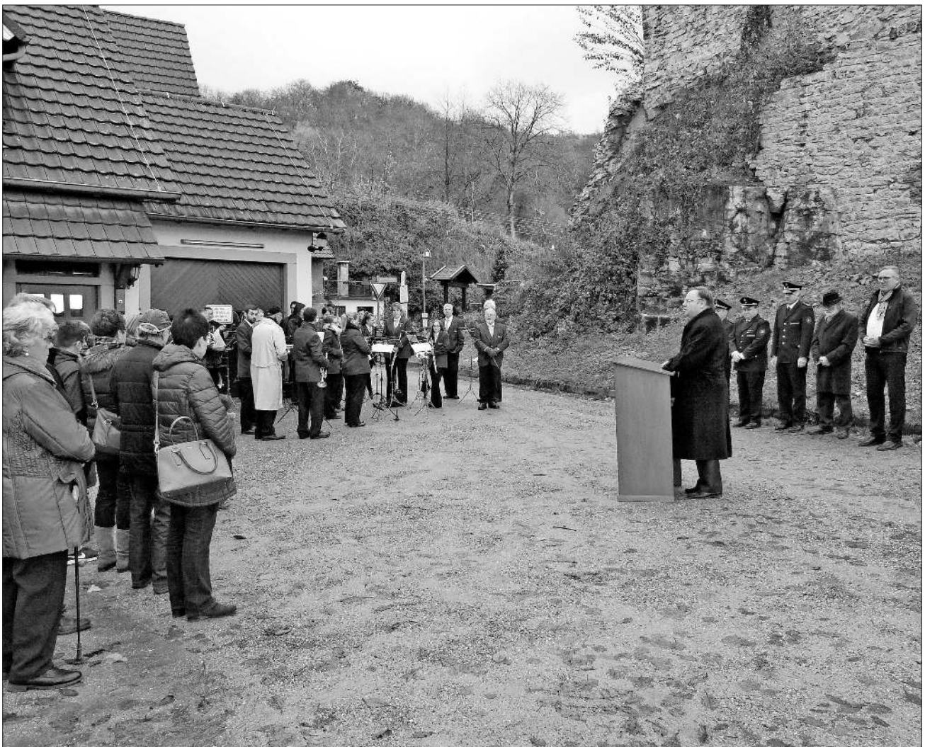
Die Gedenkfeier war gut besucht.