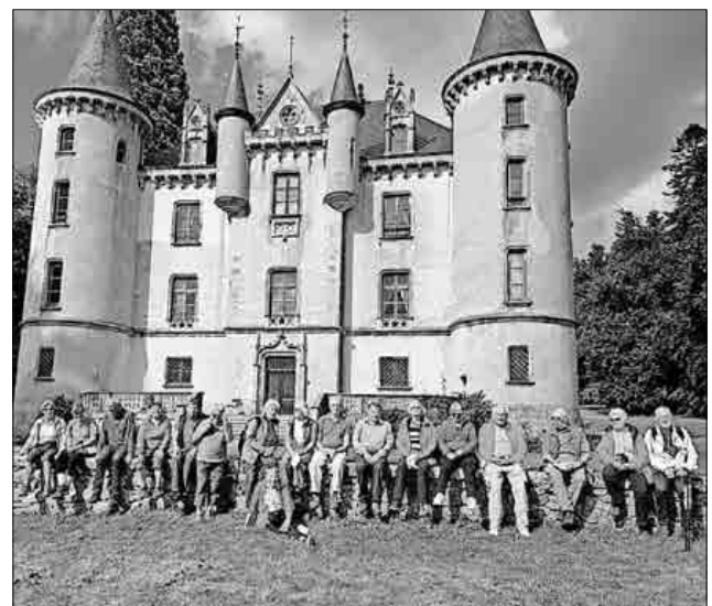
Die Gruppe vor dem Chateau de Montiver.