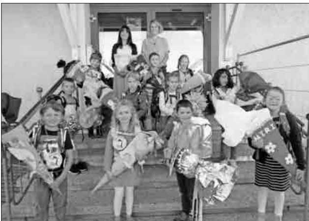
Die neuen Erstklässler der Antoniter-Grundschule Nimburg.

Während die Schulanfänger ihre erste Schulstunde im Klassenzimmer erlebten, konnten die Eltern sich bei Getränken und Gebäck (coronakonform organisiert von engagierten Zweitklasseltern) unterhalten und die schöne Atmosphäre im Freien genießen.