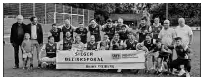
Die Alten Herren des FV Nimburg sind die diesjährigen Bezirkspokalsieger.