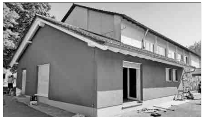
Der Jugendclub Heimbach hat ganze Arbeit geleistet. Das Jugendhaus erstrahlt ab sofort in einem tollen Rotton. Viele Arbeitsstunden der jugendlichen Vereinsmitglieder haben sich gelohnt.