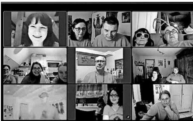
Mitglieder an den „Steh-tischen“.