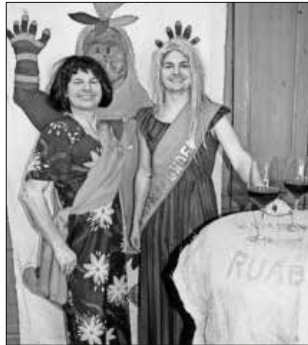
Miss Rotwein und Miss Spätburgunder.