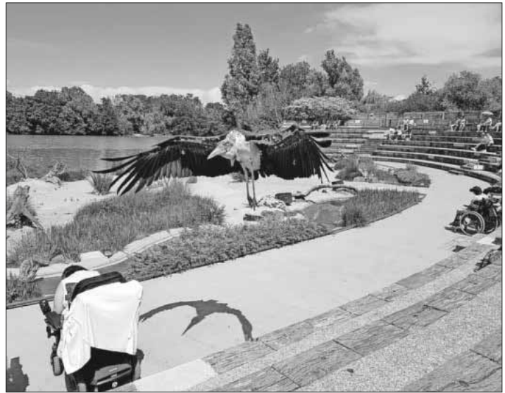
Vogel im Anflug.

Am Sonntag hieß es nach dem Frühstück Abschied nehmen mit der Hoffnung auf ein baldiges Wiedersehen.