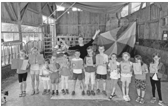
Die Kinder hatten viel Spaß bei der Clownerie.