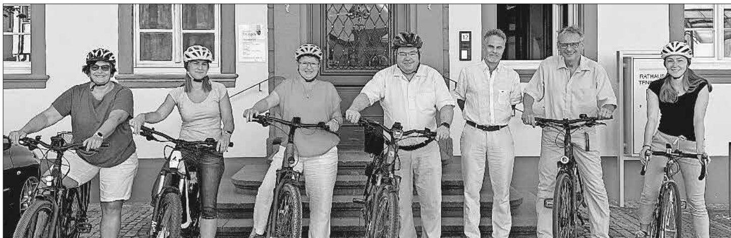
Für das Stadtradeln gerüstet.

Zur besseren Vorbereitung bitten wir Themenvorschläge und Fragen bereits vorab einzureichen per E-Mail an info@teningen.de , Betreff: Bürgermeister vor Ort in Landeck.