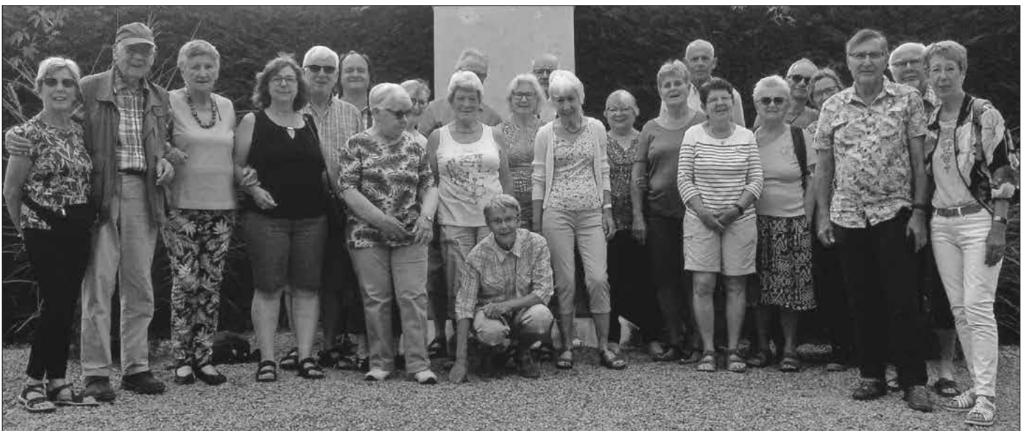
Die deutsch-französischen Wanderfreunde.