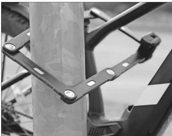
Faltschloß zum sichern von Fahrrädern.

Mehr Informationen zum Schutz vor Fahrraddiebstahl und was zu tun ist, wenn das Rad doch abhanden kommt, sowie einen Fahrradpass zum Ausfüllen findet man im Faltblatt „Räder richtig sichern“ der Polizei. Es kann hier heruntergeladen werden: www.polizei-beratung.de/medienangebot/detail/25-raeder-richtig-sichern .