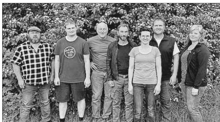
Der Vorstand des neugegründeten Vereins für Weinbaukultur Nimburg-Bottingen.

Für weitere Fragen und Informationen zum Verein: E-Mail: weinbaukultur.nimburgbottingen@t-online.de .