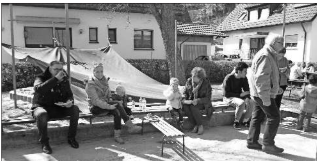
Auch vom Speiseangebot wurde gerne Gebrauch gemacht.