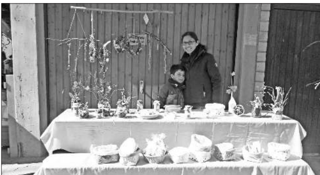
Ein reiches Angebot an selbst gemachten Sachen wurde an diesem sonnigen Freitag angeboten.

Für das leibliche Wohl war auch bestens gesorgt. Bei einer leckeren Suppe mit Würstchen oder Pellkartoffeln mit Frühlingsquark und zum Nachtisch eine Waffel oder Hefezopf konnte man es gut auf dem Hof des Kindergartens aushalten und nette Gespräche führen.