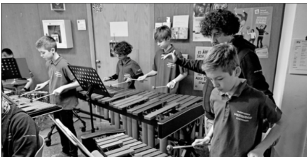
Voller Einsatz am Xylophon, Marimba und Glockenspiel.