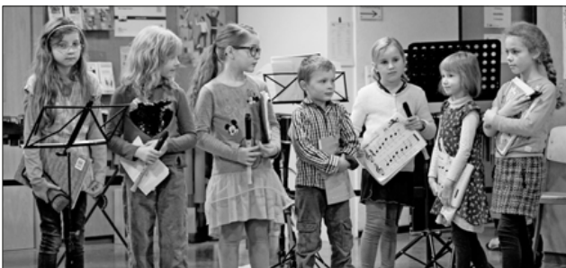
Die Blockflötenkinder stehen bereit.