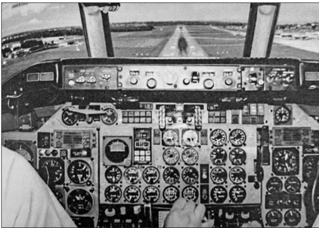
Der Arbeitsplatz eines Piloten.