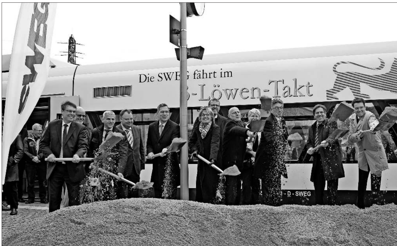
Strahlende Gesichter beim Spatenstich.

Die SWEG Schienenwege GmbH ist eine Tochtergesellschaft der Südwestdeutschen Verkehrs-Aktiengesellschaft. Sie betreibt die Eisenbahninfrastruktur auf den Strecken Bad Krozingen – Staufen – Münstertal, Riegel-Malterdingen – Endingen – Breisach, Riegel Ort – Gottenheim, Achern – Ottenhöfen, Biberach – Oberharmersbach und Bühl – Stollhofen. Das Unternehmen beschäftigt 31 Mitarbeiter.