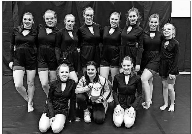
Die erfolgreichen Tänzerinnen.

In der Tabelle der zehn Mannschaften belegt „Joukko“ nach drei der vier Saisonwettkämpfe einen sicheren 5. Platz, mit guten Chancen, die Saison auf Platz 4 beenden zu können.