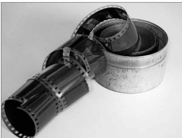
Die gefundene Filmrolle mit den Bildern der ehemaligen Schüler.

„Wer genau ist eigentlich nochmal für das Aufräumen unserer Schränke verantwortlich?“, fragten sich die Schüler, als sie im letzten Schrank in der Ecke eine Filmrolle fanden – und sich wie Schatzsucher fühlten. Denn es handelte sich um einen historischen Fund! Wie bereits in der Presse berichtet, sind in der Nikolaus-Christian-Sander-Schule noch einige andere Schätze, zum Beispiel Bilderalben aus den Jahren 1930 bis 1970 zutage gekommen. Die Schulbilder aus dem Schuljahr 1948/49 werden bereits seit Februar im Foyer der Schule ausgestellt. Immer wieder treffen sich hier ehemalige Schülerinnen und Schüler, die damals hier ihre Schulzeit verbrachten. Viele Geschichten werden erzählt über die einzelnen Personen, ihre Eigenheiten und Schicksale. Von den 242 Fotografierten wurden durch die Besucher bereits 219 identifiziert.