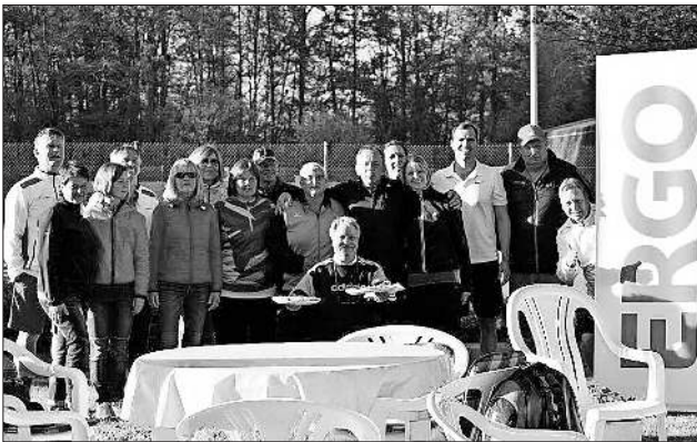
Die Teilnehmer beim Mixed-Cup.

Das Turnier wurde von den Teilnehmern aus der ganzen Region gut angenommen. Alle hatten Spaß und Freude bei den Spielen um Punkte auf dem roten Untergrund. Alles in allem war der 1. ERGO-Mixed-Cup eine gelungene Veranstaltung, die im nächsten Jahr bestimmt eine Wiederholung finden wird.