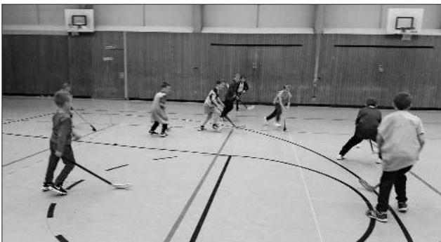
Sport und Fun beim Ferienprogramm.