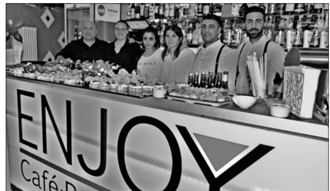
Das Enjoy-Team freut sich auf viele Gäste.