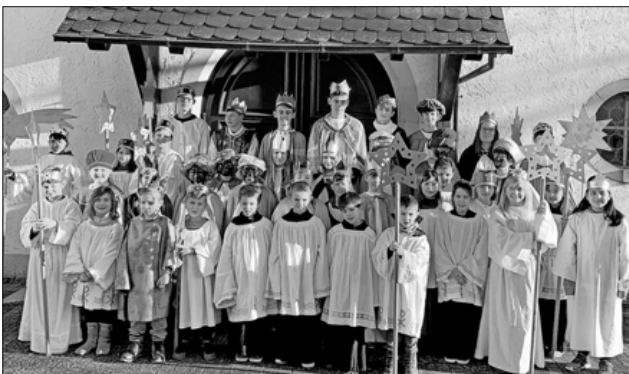
Die diesjährigen Sternsinger.

Nach dem Gottesdienst gab es im Gemeindehaus ein gemeinsames Essen für alle Beteiligten.