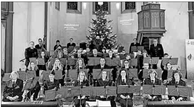
Der Musikzug der Abteilung Köndringen.