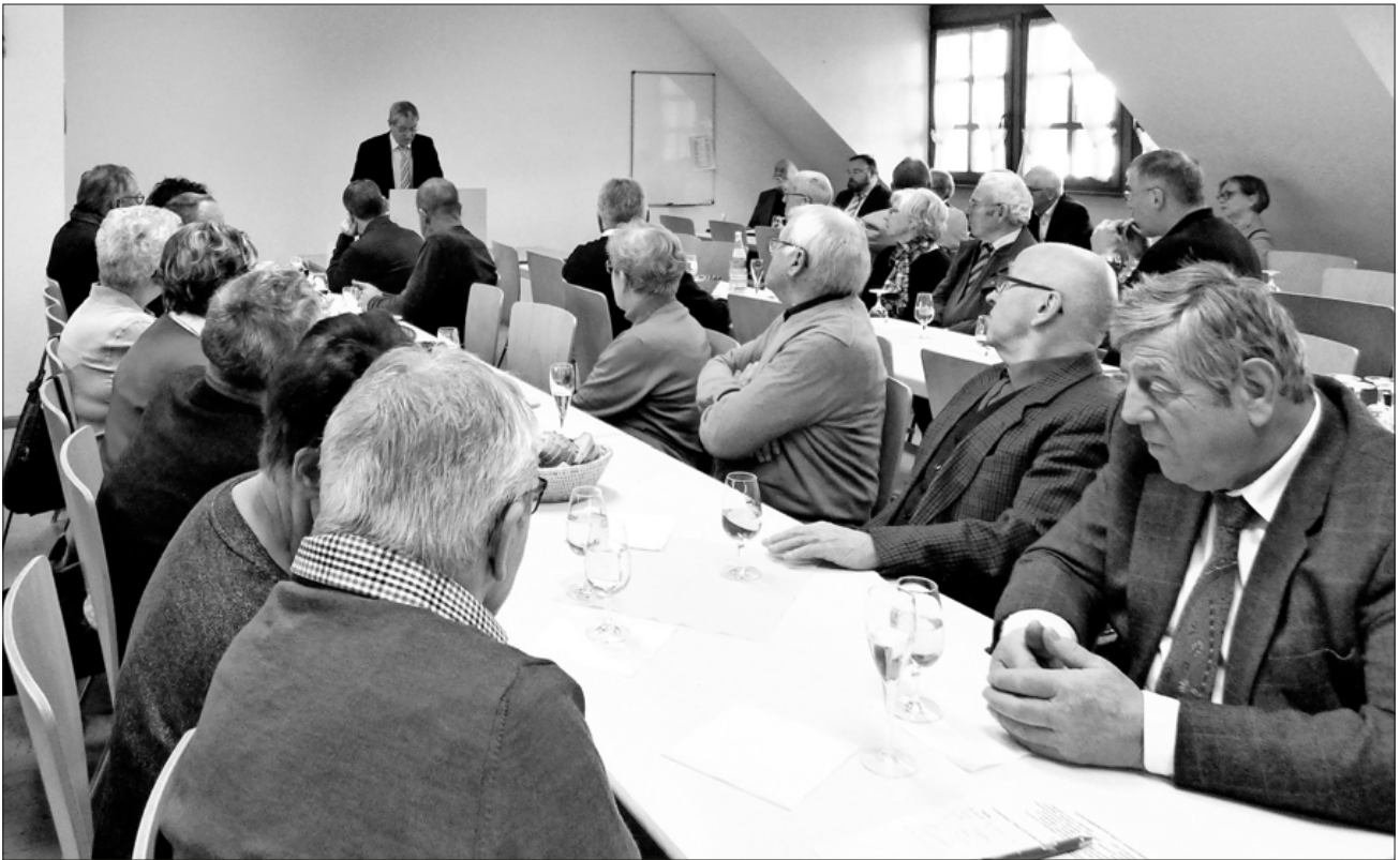
Viele Fragen wirft nun der Umzug der Werkrealschule, die Teilung des Kollegiums und die Sanierung der Nikolaus-Christian-Sander-Schule auf, sagte Gaisser zum Abschluss seines Berichtes.

Erlös wurde der Stiftung Brücke gespendet. Auch die Auszeichnung zur MINT-freundlichen Schule trägt die Schule laut Gaisser durch die Forscher-AG zurecht. Gute Ergebnisse erliefen sich die Schüler beim Emmendinger Stadtlauf und ein großes Erlebnis hatten sie bei der Teilnahme am deutsch-französischen Tanzprojekt mit der Vorführung des Ergebnisses im Europa-Park. Viele Fragen wirft nun der Umzug der Werkrealschule, die Teilung des Kollegiums und die Sanierung der Nikolaus-Christian-Sander-Schule auf, sagte Gaisser zum Abschluss seines Berichtes.