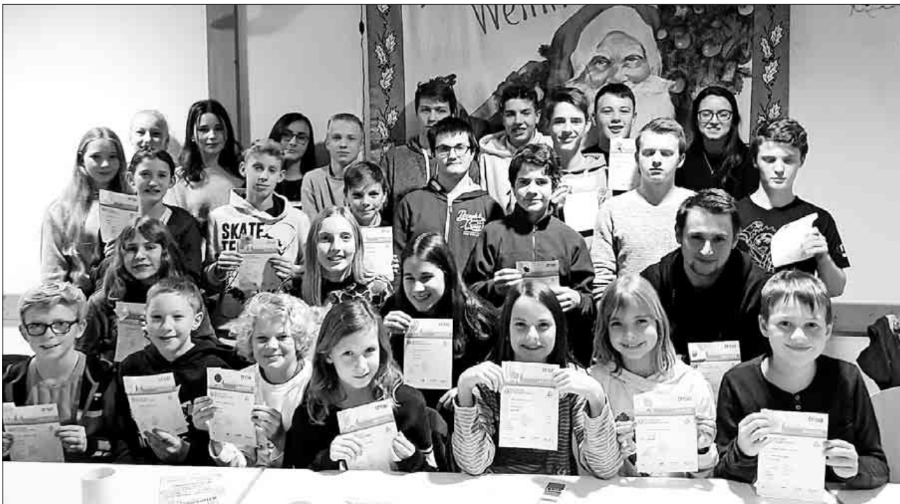
Die Schüler- und Jugendathleten erhielten bei der Jahresabschlussfeier die Sportabzeichen.

Die TuS-Leichtathleten bedanken sich bei allen Eltern der Athletinnen und Athleten für die tatkräftige Unterstützung und wünscht alles Gute für 2019.