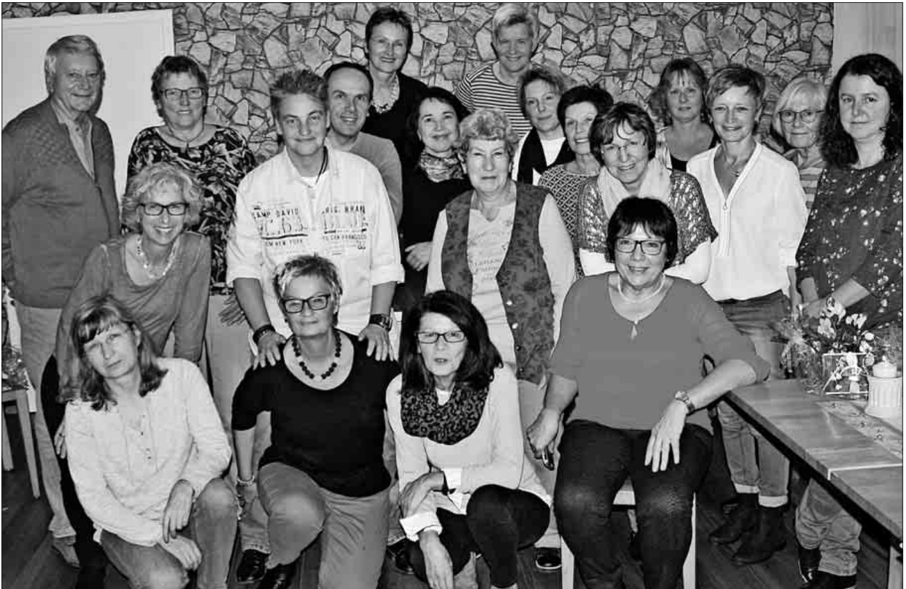
Die Landfrauen feierten den Jahresabschluss.