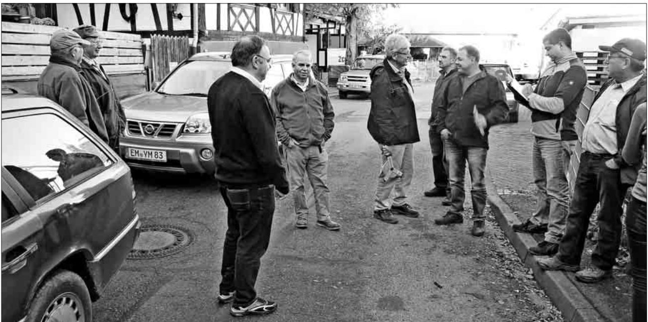
Die sehr alte Verbindungsstraße von Bottingen nach Neuershausen ist oft wegen falsch geparkten Autos für die landwirtschaftlichen Fahrzeuge ein Problem.