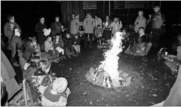
Ein wärmendes Feuer erwartet Groß und Klein, besonders aber Familien mit ihren Kindern.