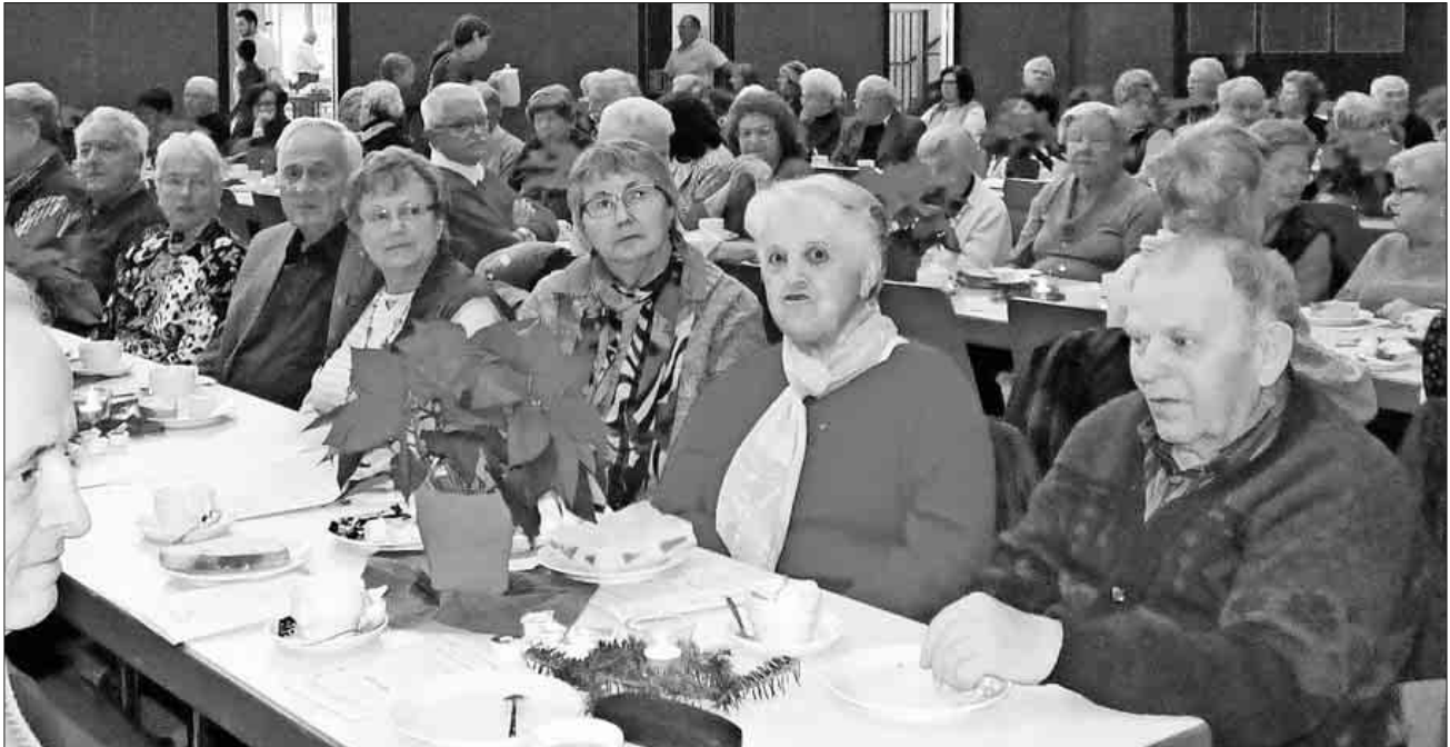
Gute Unterhaltung bei Kaffee und Kuchen.

Was man auch als einen einladenden Hinweis für diesen unterhaltsamen Seniorennachmittag im nächsten Jahr verstanden werden kann.