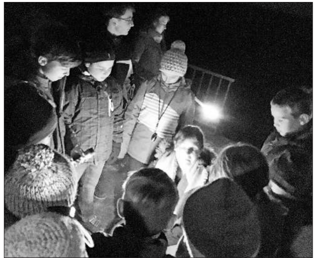
... bei der es die eine oder andere Gruselgeschichte zu hören gab.