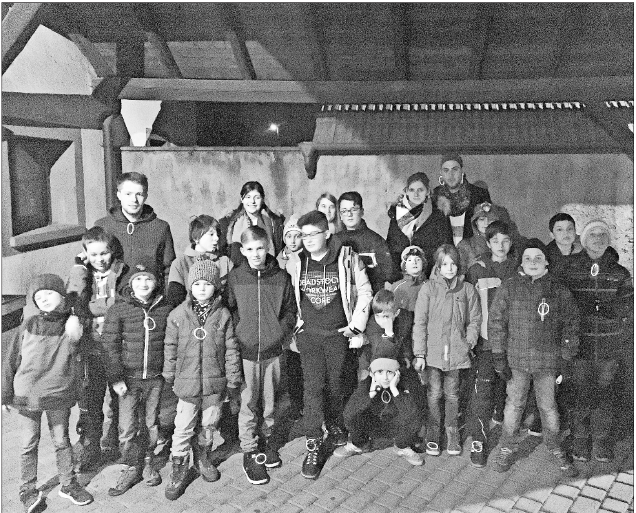
Voller Spannung sind die Azubis bereit zum Abmarsch zur Nachtwanderung, ...