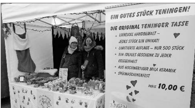
Mit dem Verkauf der „Teninger Tassen“ will der Kindergarten St. Franziskus notwendige Investitionen finanzieren.