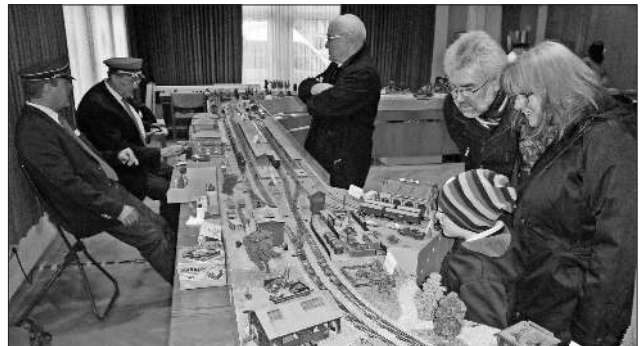
Zum dritten Mal hatte der Freiburger Modelleisenbahnclub seine großartige Bahn aufgestellt, und nicht nur die ganz jungen Männer in den Bann gezogen.