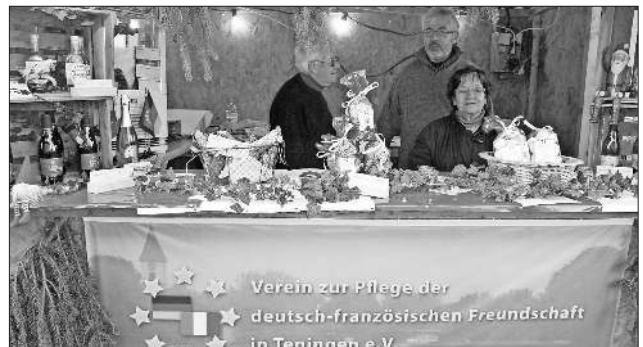
Der deutsch-französische Verein warb mit Produkten aus Savoyen für die Partnerschaft mit La Ravoire.