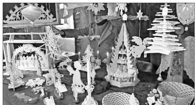
Viel Zeit hat dieser Holzkünstler in jede seiner filigranen Holzarbeiten gesteckt.