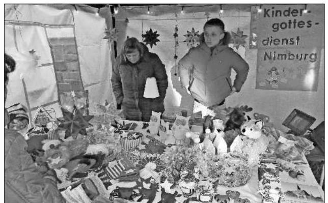
Auch das Kindergottesdienst-Team von Nimburg bereicherte den Weihnachtsmarkt mit seinen selbst gemachten Bastelartikeln.