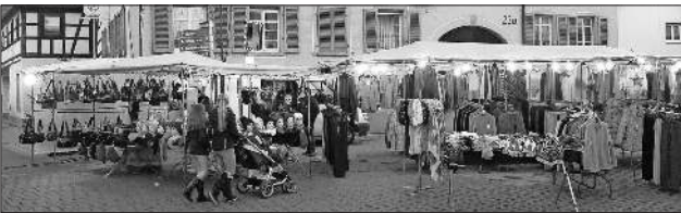
Mit oft rekordverdächtig ausladenden Ständen vergrößerten die kommerziellen Besucher den Markt.