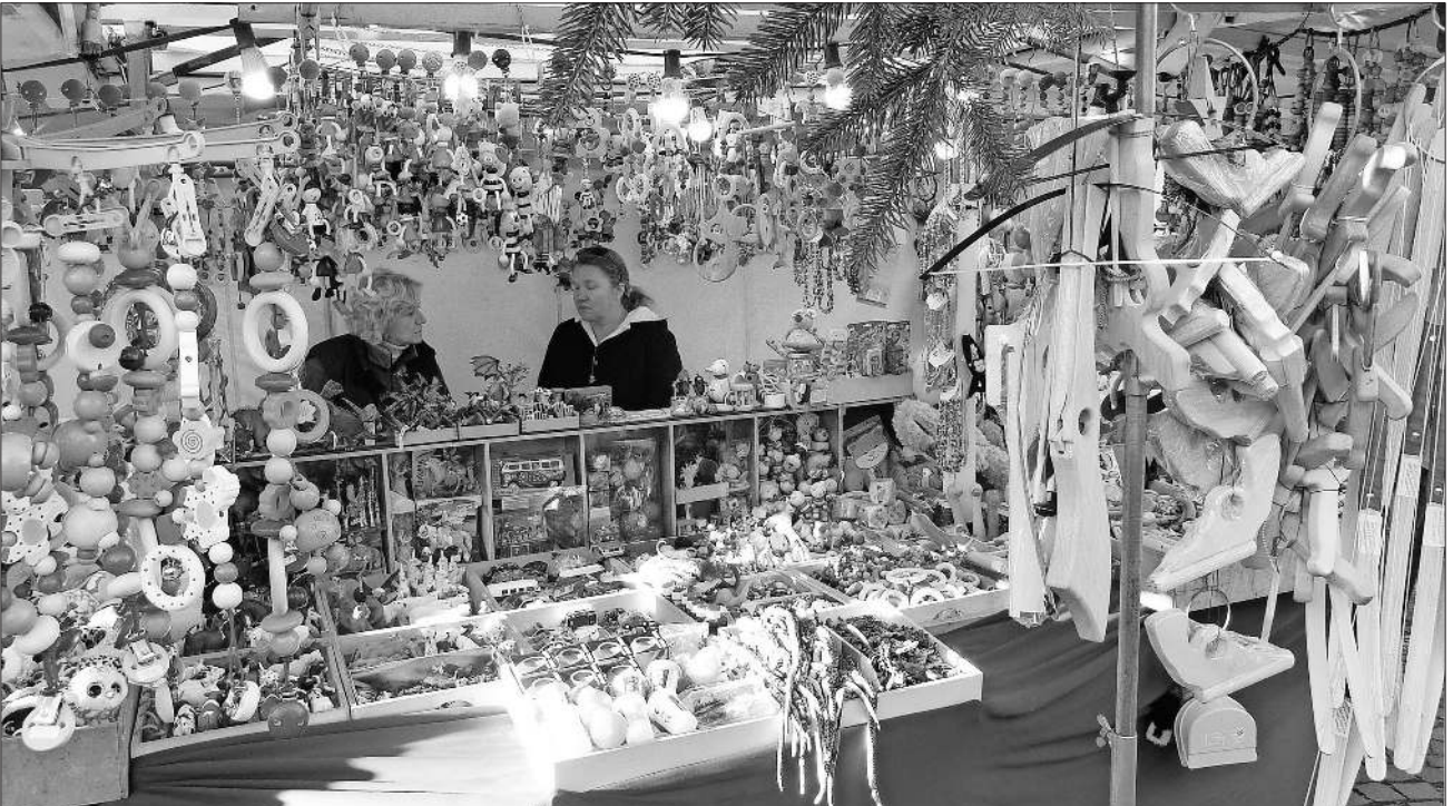
Traditionelles Holzspielzeug ließ manchen älteren Besucher wieder an frühere Weihnachten denken.