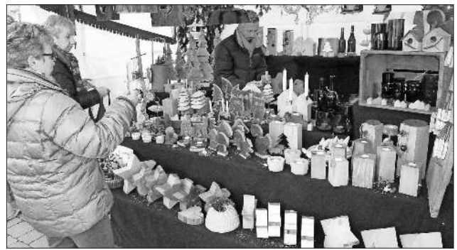
Mit viel handwerklicher Begabung sind die Marktstände entstanden.