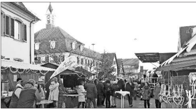
Das Rathaus ist ein passender Hintergrund für den Weihnachtsmarkt.