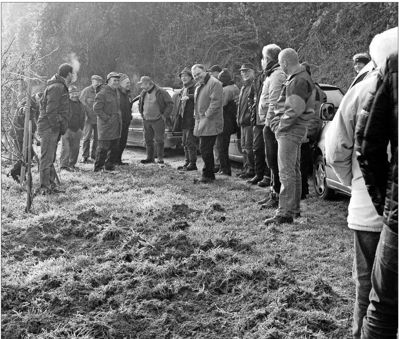
Hier waren die Wildschweine am Werk.

Dachsbauten und allgemeine Wildschäden sind ebenso stets ein Thema, doch auch hier konnte man gegenüber dem letzten Jahr positive Ergebnisse vorweisen.