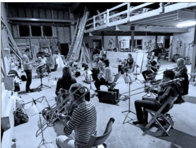
Der Musikverein Heimbach probt in Räumen der Zimmerei Bär.