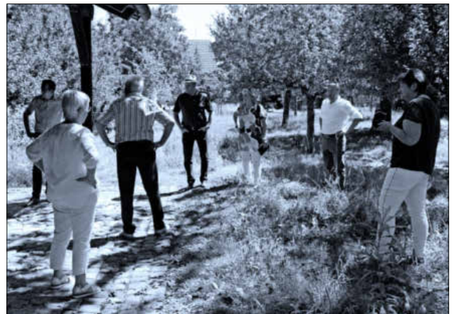
Vor der historischen Hanfreibe im Mentongarten wurden allgemeine Probleme der Vereine in Zeiten der Pandemiekrise diskutiert.

Die Abgeordneten möchten sich für eine dezentralisierte Förderung solcher Einzelprojekte einsetzen und nicht nur „Leuchtturm“-Unterstützung von wenigen Großprojekten betreiben. Man sieht in der Sanierungsarbeit des Teninger Heimatmuseums keine Umsetzung im Sprint, der wünschenswert wäre, sondern eine Marathonaufgabe, für die viel Geduld aufgebracht werden muss. Das Erbe beinhaltet eine enorme Herausforderung, die es aber wert sei, um geschichtliches Leben in der Gegenwart zu veranschaulichen.