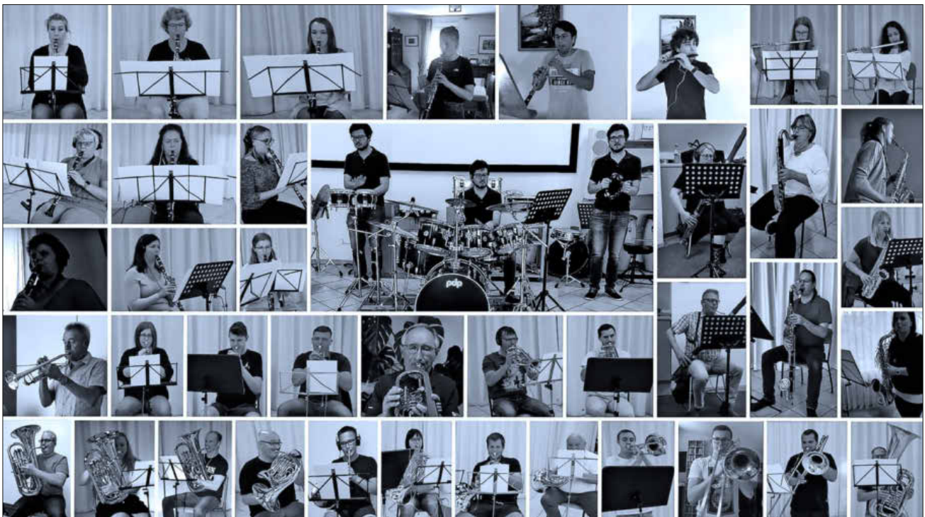
Die Musiker erprobten eigenständig das Musikstück „Latin Fever“.

Das Ergebnis ist nun auf Youtube, facebook und auf der Homepage der Winzerkapelle Köndringen zu begutachten.