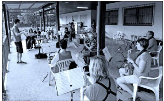
Der Musikverein Heimbach probt auf dem Sportplatz.

Auch wenn es noch einige Einschränkungen gibt, so ist nun doch wieder ein Stück Normalität zurückgekehrt und die Musikerinnen und Musiker freuen sich, endlich wieder gemeinsam zu proben.