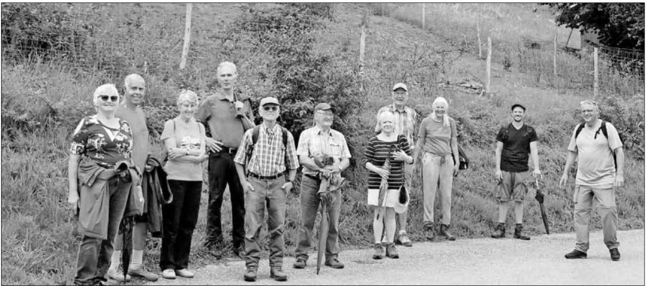
Wandergruppe vor Beweidungsfläche am Neuweg.

Fazit des Umweltbeauftragten: Nur durch die gute Zusammenarbeit von Gemeinde, Grundstückseigentümern und Tierhaltern ist Erfolg möglich. Die Teilnehmer der Wanderung fanden die Vorstellung des Projektes interessant und aufschlussreich. Mit einer Einkehr im Schlosscafé endete der Nachmittag.