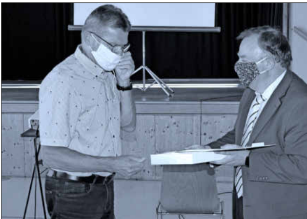
Eine Ehrung mit Maske hat eher seltenheitswert.

Für ihn selbst war die stets positive Stimmung und die kollegiale Zusammenarbeit im Ortschaftsrat eine motivierende Triebkraft. „Es kam selten zu Konflikten oder gar Kampfabstimmungen im Rat. Für uns standen das Wohl und die Entwicklung unseres Dorfes immer im Vordergrund. Mein Herz schlägt zwar politisch links, doch es schlägt immer für Heimbach“, sagte er in seinem Dank für die Würdigung.